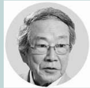
（写真）堀尾輝久・東大名譽教授

戦争を禁止する条項を憲法に入れるようにという提案は、幣原首相が行ったのです。首相は、わたくしの職業軍人としての経歴を考えると、このような条項を憲法に入れることに対してわたくしがどんな態度をとるか不安であったので、憲法に関しておそろおそろわたくし