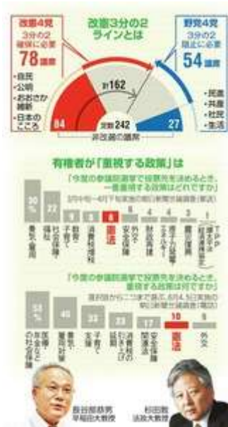
改憲3分の2ラインとは／有権者が「重視する政策」は

消費増税の再延期をめぐり、参院選で「新しい判断の信を問う」とした安倍晋三首相。長谷部恭男・早稲田大教授（憲法）と杉田敦・法政大教授（政治理論）の連続対談は今回、22日の公示を前に、この選挙で問われる日本政治のありようを見つめ直す。