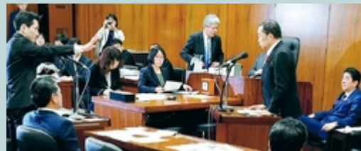
(写真) 安倍首相(右)、金田法相(その左)に質問する藤野議員(左) = 19日、衆院法務委