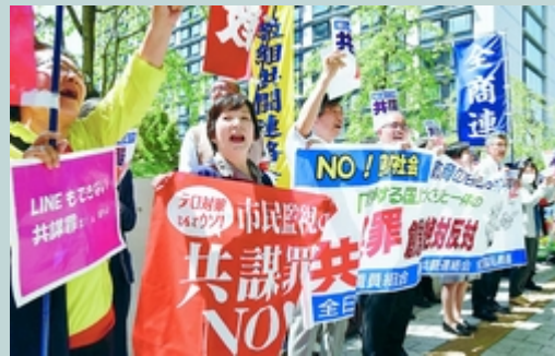
(写真) 「共謀罪」法案の本格審議入りで国会前の抗議行動に集まった人たち＝19日、衆院第2議員会館前

安倍首相は「法案成立後も、警察の活動は法令に従って適切に行われる。一般人は対象にならない」と従来通りの無反省な答弁を繰り返しました。