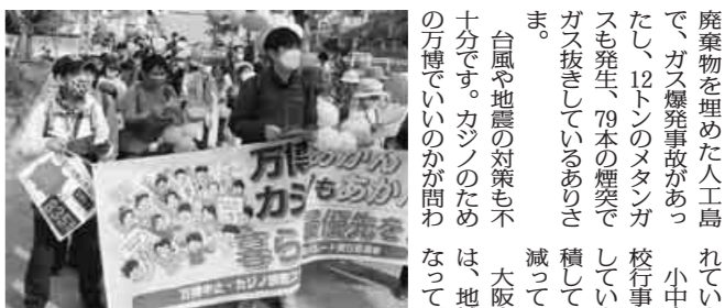
万博反対・カジノあかんと訴えたパレード

万博反対の署名を集めたい。都構想の住民投票を2回やったが、万博で住民投票を要求したが会場、万博ではごみや