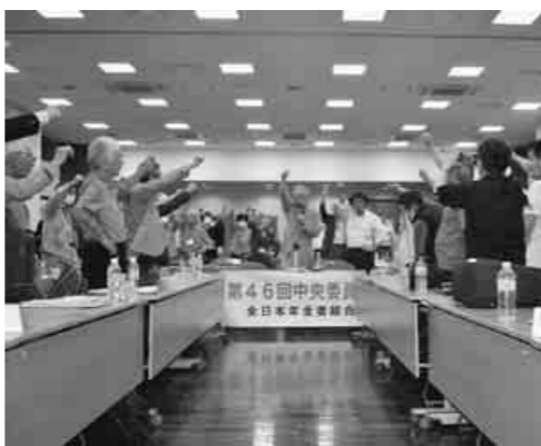
中央委員会最後に団結ガンパロー

年金引き上げの意見書採択を求める取り組みについて発言します。1月の支部代表者会議での提起を各支部が「待ってま