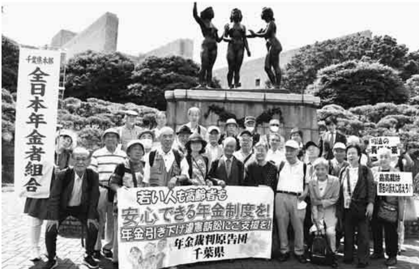
一大事と多くの原告組合員がかけつける 〈千葉県本部〉

現役労働者や学者の証言によって、年金問題が労働者全体の課題であることが、最低保障年金の確立が若い世代にとっても切実な課題であることも明らかにになりました。これらの点に確信をもって、引き続き運動を進めていきたいと思います。