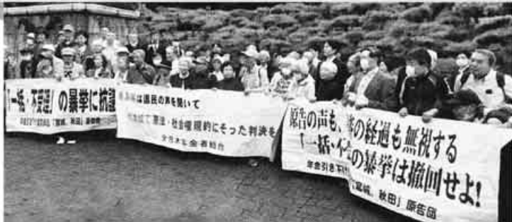
最高裁前の三宅坂小公園に集まった全国の原告、組合員

5/31 山梨、奈良、東京、宮城・秋田、福岡・佐賀、岩手、鹿児島、長崎 6/3 岐阜、山形、滋賀、長野、栃木、群馬、大阪 6/7 富山、千葉、熊本、京都、宮崎、愛知・三重