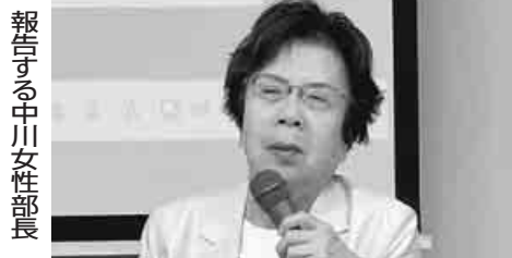
報告する中川女性部長