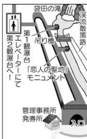
袋田の滝 浮流散策路 第一観瀑台 エレベーターで第二観瀑台へ! 「恋人の聖地」モニュメント 管理事務所 発券所

滝の高さは120メートルで幅は73メートル、四段に落下することから別名「四度の滝」とも。