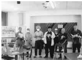
長野・桜まつり誕生会