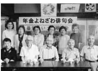
山形・俳句会暑気払い

7月18日年金よねざわ俳句会は11人で「暑気払い」を開きました。須貝支部長は「毎月の句会や他の句会との交流などの活動に敬意を表します」とあいさつしました。