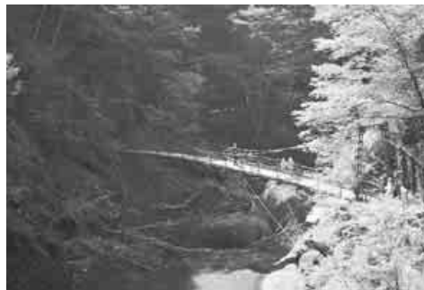
吊り橋からも滝が