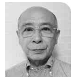
廣岡国際部長 写真に聞きまし

年金者組合は、11月25日から12月7日まで開催される、ILO条約勧告適用専門家委員会に対して、8月22日「申立て」を行いました。