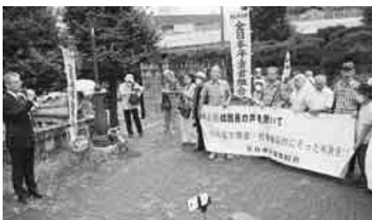
最高裁不当判決で抗議(最高裁前)

本日、最高裁判所第一小法廷は、平成25年10月の年金減額決定を取り消すことを求めた上告審で、島根、福島、広島、埼玉、新潟の各事案について、第2小法廷の22事案に引き続いて、上告棄却の不当判決を言い渡した。