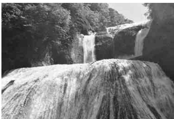
第一観瀑台から見た滝

第一観瀑台に立つと、視線の先は、しづぎと霧雨で煙ったよう。観爆用の椅子は、飛び散る水し