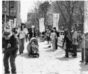
札幌・敬老パスの宣伝