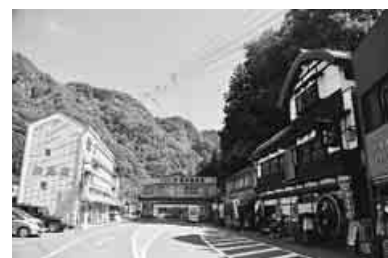
並んだみやげ物店