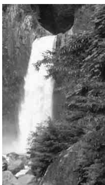
苗名滝(新潟県妙高市)