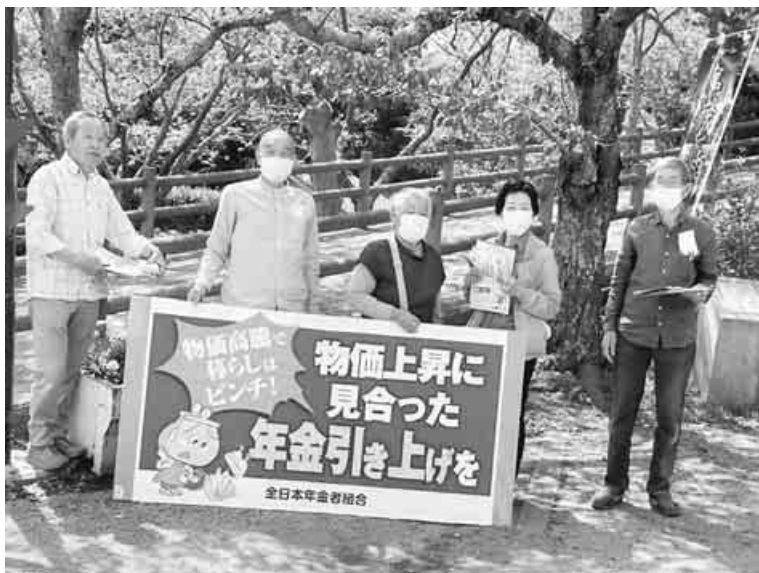
千葉安房支部署名宣伝 (館山城内)

裏金の自民党政治もうたくさん 九条外交で戦争しない政府を 物価上昇を上回る年金の増額を 抗議声明 要約2面 凍として訴えました。