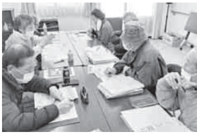
メリットは共済学習会

山口県本部は2月18日、「仲間ふやしと共済」をテーマに金労連共済学習会を行い5支部が参