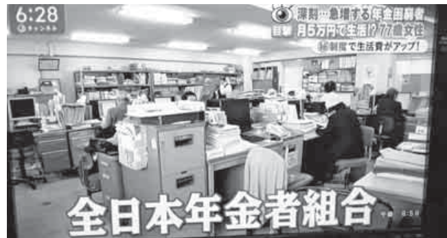
テレビ朝日で報道された年金で本部の画像

5 まとめ 全日本年金者組合の基本要件は、国民が求める年金制度の改革を提案している。特にマクロ経済スライドの廃止や最低保障年金制度の創設は、高齢者貧困や女性の低年金問題を解決するための鍵である。しかし、「次期年金改正案」はこれらの