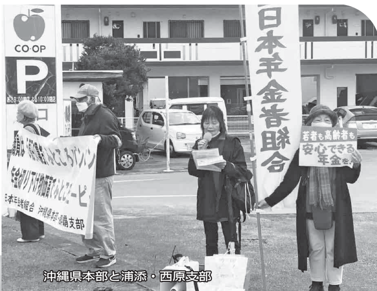
沖縄県本部と浦添・西原支部

キャベツ3倍、お米は過去最高の1.7倍など食料品の値上がりは、消費税の負担増となり暮らしを直撃しています。年金者組合は、「食料品にかかる8%の消費税をゼロにせよ」「税率を下げて600兆円も内部留保をため込んでいる大企業の法人税率を元に戻せ」と国に強く要請し続けています。