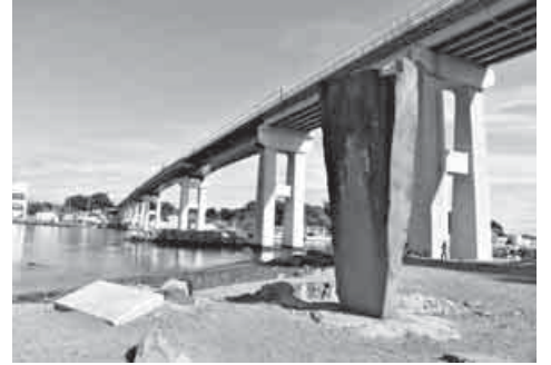
城ヶ島の雨の歌碑

島は三崎港の200メートルほど沖合にある周囲約4キロメートル。晴れていれば、東に房総半島、西に富士山が望める