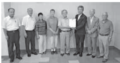
議会議長に請願書を渡す「大船渡の会」

大船渡市老人クラブ連合会、市身体障がい者協会など5団体が出した「健康保険証の存続を国に求める請願」が岩手県大船渡市議会