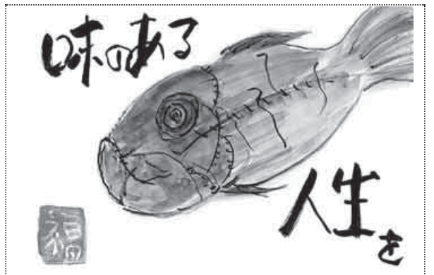
北海道・札幌市 福本 洋子