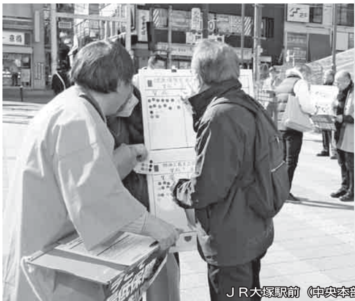
JR大塚駅前(中央本部)