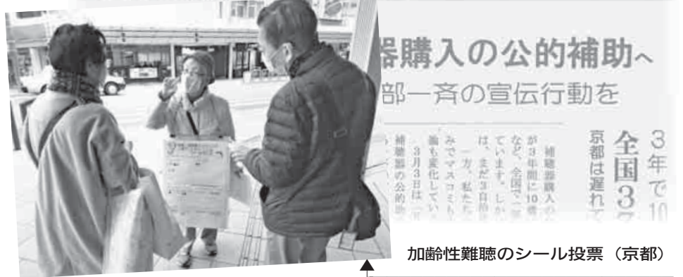
加齢性難聴のシール投票 (京都)

補聴器購入者に助成する自治体がこの2年間で急増。年金者組合やまちづくり運動、議員団との連携、日本耳鼻咽喉科学会などの取り組みの広がりで、認知症の最大の要因と言われる加齢性難聴者は1430万人。助成を求める運動は補聴器の機能改善にも貢献しています。一足早く運動を始めた年金者組合に期待が寄せられています。