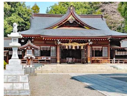
水前寺公園に隣接する出水神社

この他に、年4回の誕生会、共同墓「安らぎの丘」の運営、補聴器購入補助の実現など、行政への働きかけも盛んでその成果も見られます。また、市庁舎建て替えの大型事業に対する疑問の声がある。