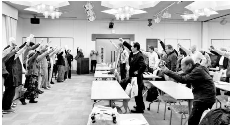
茨城県いこいの村酒沼

3月5～6日、茨城県のサークル活動の案内を公民館においてもらい、案内を見た人が参加しました。と公民館から連絡が来ます。