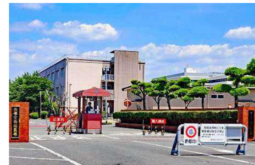
ミサイル配備を進める健軍駐屯地

午後の部は、寸劇やコントなど19組(人)が出演し、楽しい行事が行なわれます。こうした交流の場は組合員の結束を高め、組織拡大にもつなげる重要な役割を果たしている。