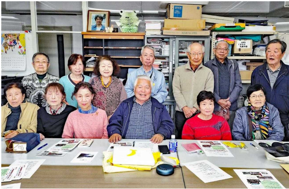
熊本支部のみなさん