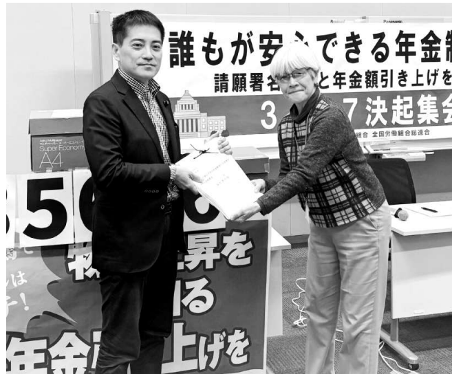
辰巳衆院議員（日本共産党）に請願署名を託す

年金者組合と全労連は3月17日、「誰もが安心できる年金制度への改善を求める」請願署名採択と「物価上昇を上回る年金額引き上げ」を求める決起集会を、衆院第2議員会館とオンラインを結んで開催しました。参加者は署名を国会に提出し、国会議員要請を行いました。