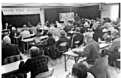
東京都本部(支部長 書記長会議)