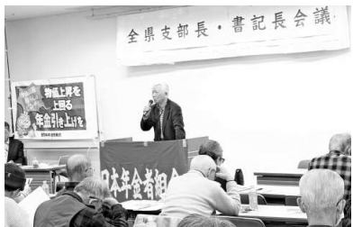
埼玉県本部(支部長 書記長会議)