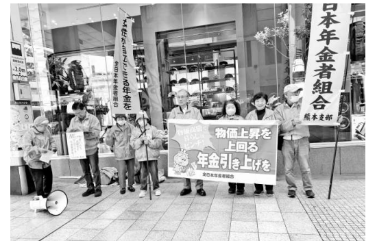
熊本県本部熊本支部