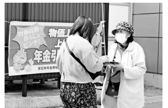
青森県本部三八支部

年金者組合は4月15日、全国いっせい宣伝・署名に取り組みました。全国で「物価上昇を上回る年金額の引き上げ」、「反戦平和」を求めてスピーチを行い、横断幕を掲げました。中央本部が行った宣伝行動のチラシを見たとい