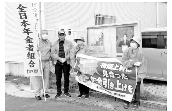
愛知県本部豊橋支部