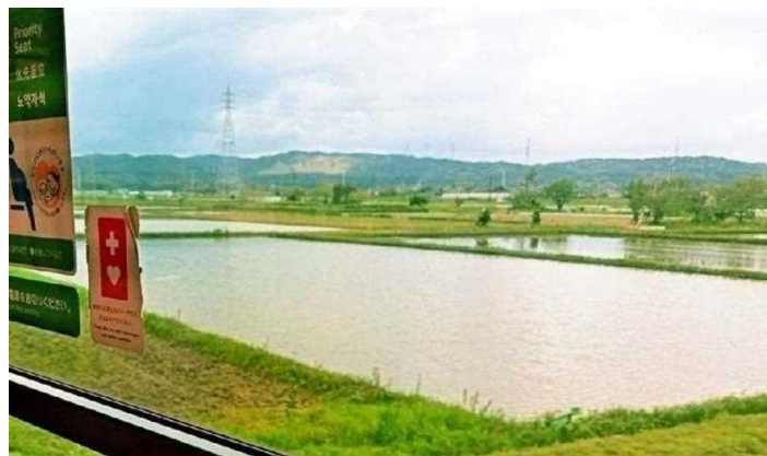
車窓に広がる田園風景はのどかだ

者にとつてはなくてはならない存在です」。 「2023年3月に策定された君津市都市計画マスタープランによれば、『久留里線は、通勤・通学や買物などの暮らしにかかわる様々な人々の移動を支えるとともに、商業や産業機能、観光交流機能へのアクセシビリティを高める軸』と位置付けています」。