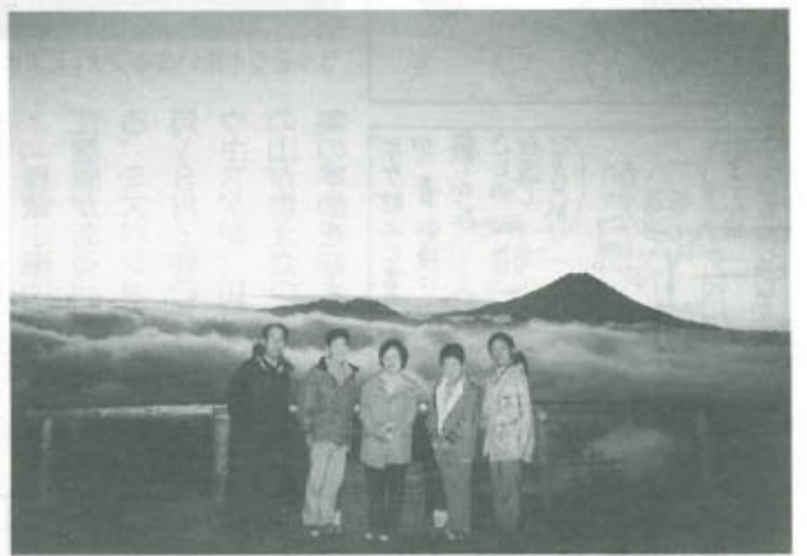
御坂山系から昇るご来光を背に

9月25、26日、御嶽山へ21人が参加して、1年前に亡くなった仲間2人の追悼登山をしました。登り口近くで「雪山讃歌」を歌うなどの式典を行い、お神酒で「献杯」をしました。支部は、仲間づくりで9月も7人を迎えるなど23カ月連続拡大で史上最高の峰を更新中です。(山本紘司)