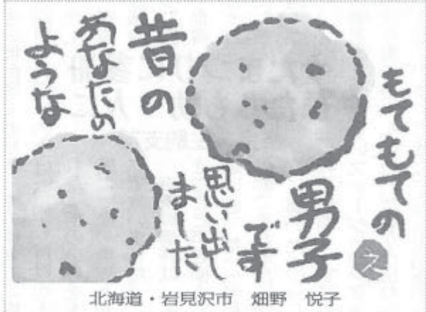
北海道・岩見沢市 畑野 悦子