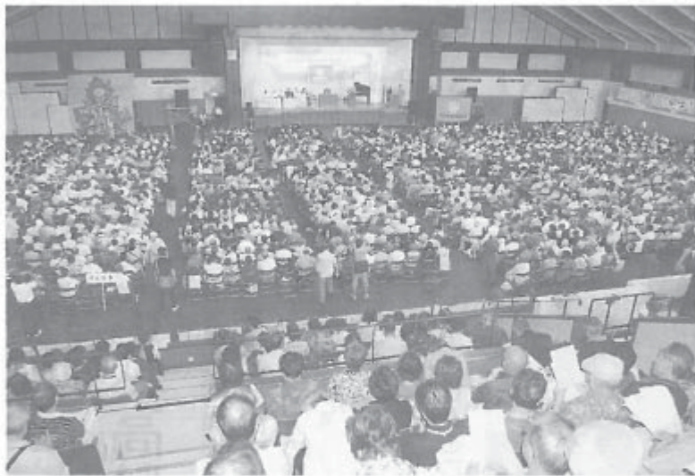
茨城県立武道館をうめ尽くした参加者

「消えた高齢者」、熱中症による死亡など、高齢者の命と暮らしが極限まで脅かされているなか