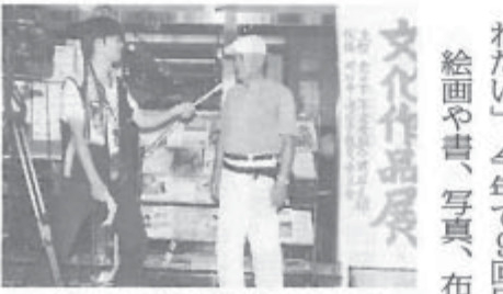
地元のテレビ取材を受ける