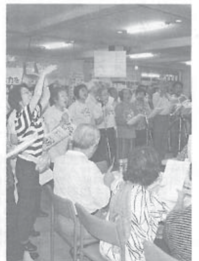
歌声酒場で240人の大合唱

「まずあいさつ」など近所づきあいの延長線上での声かけから始めようとのべ、もし自分がひとりぼっちになったときは素直に他人の手助けを受け入れるような活動もすすめようと話しました。