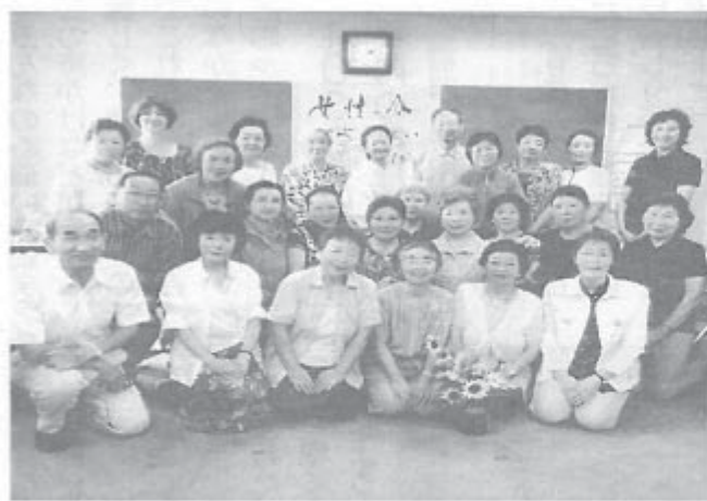
「女性の会」なので支部の女性組合員は全員が構成員ではないか—の発言も出て、賑やかに討議をした結成総会・出席者全員の記念写真。

9月7日、秋田・大館 支部が誕生しました。支部で県本部3番目の女 大館市中央公民館に男