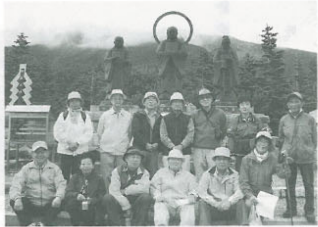
献杯と雪山讃歌で仲間2人を追悼