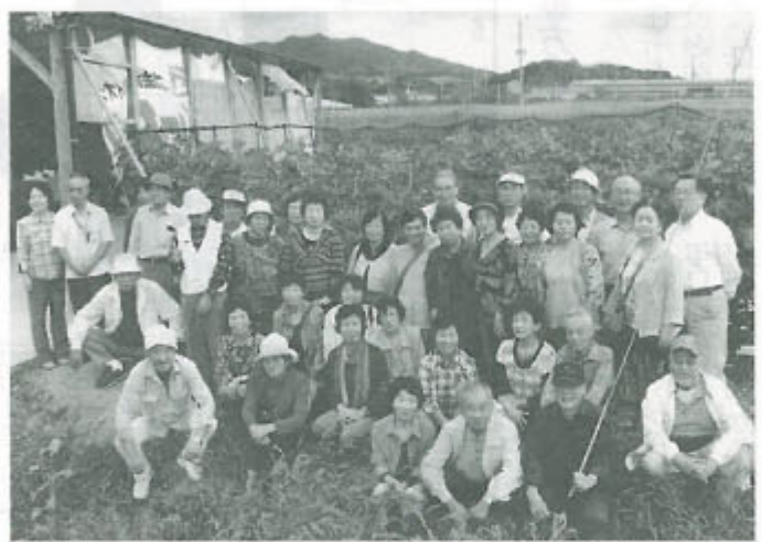
イチシク農園前で甘い香りに囲まれながら