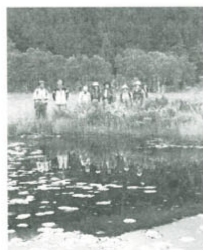
尾瀬ヶ原は別世界、「歩く会」で

9月24日、8人で尾瀬へ。10時30分鳩待峠を出発、山の鼻経由で温泉へ。一面の草紅葉・童宮経由で牛首からトリンドウのあざやかな青色に感嘆。至仏山が燦岳が原の彼方に頂きをのぞかせている。東電小屋3時着。25日は気温8度霧雨、6時発。見晴らし