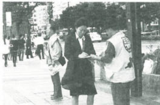
▲集会と署名行動のあと福岡市内をパレード