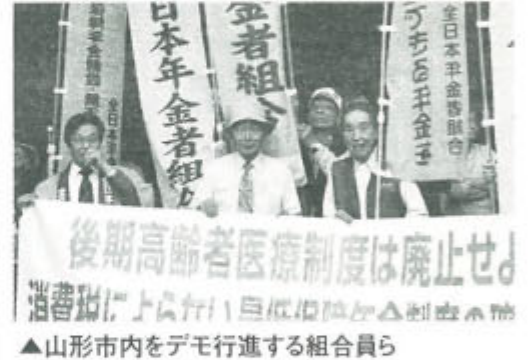
▲山形市内をデモ行進する組合員ら