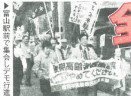
▶富山駅前集会しデモ行進