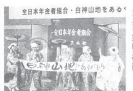
全日本年金者組合・白神山地をあるく

「岳岱自然観察教育林」や釣瓶落跡では、曇り空のやさしい光がブナの黄葉に幸いし、盛りにも劣らない黄金色に染め