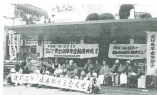
▲愛媛は松山市駅前の「坊っちゃん広場」で座りこみ