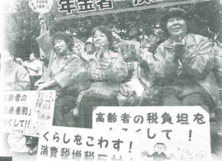
▲東京・日比谷野外音楽堂の中央集会