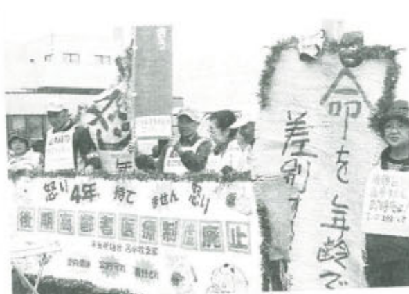
▲北海道苫小牧市内で宣伝と署名