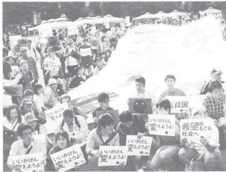
「いいかげん変えようよ」のスローガンをかかげる集会参加者

「いいかげん変えようよ!」希望のもてる社会へ!をスローガンにかかげた反貧困世直し大集会が10月16日、東京・明治公園で開催され、1200人が参加しました。反貧困ネットワーク実行委員会(代表・宇都宮