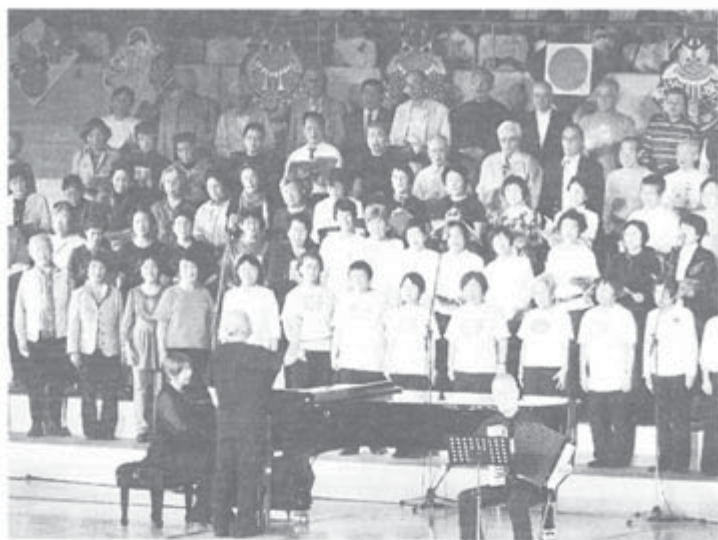
2010年日本の祭典in長崎で高齢者は「かけがえのない人生」「折り鶴」を元気に歌いました

《感想》〇初めて 参加、女性パワーに 驚いた。〇同じテー マの分散会で良かっ た。〇地域によって 女性の会の活動は多 種多様、それぞれ勉 強できた。〇女性の 会の必要性について は更に討論を。〇女 性の役員割合をも っと増やそう。〇女 性の年金についての 学習の機会を。