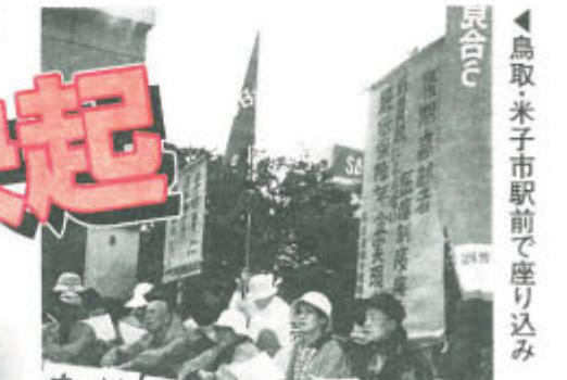
▲鳥取・米子市駅前座り込み