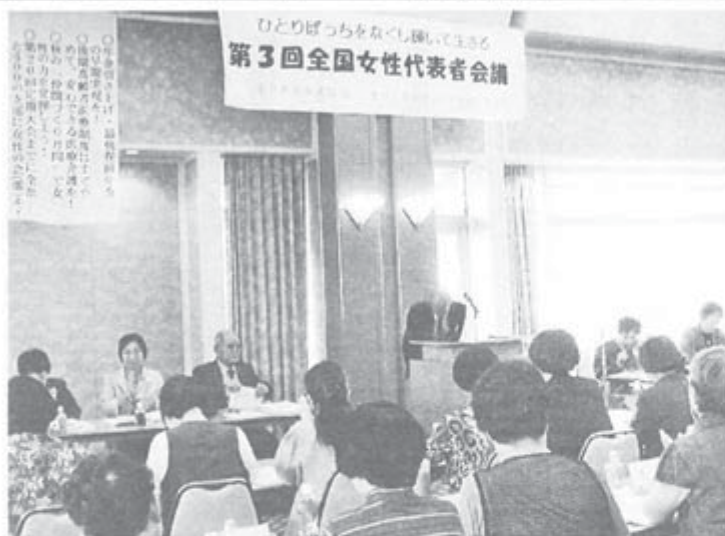
本会議も分散会も夕食交流会も活発・盛況だった 第3回全国女性代表者会議

年金者組合の第3回全 海岸の「シーパル須磨」 国女性代表者会議は10月 11日・12日、兵庫県須磨