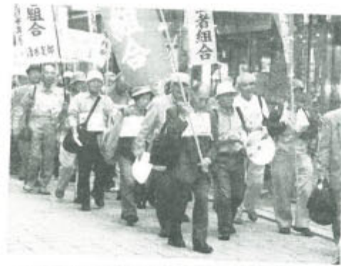
▲定期大会終了後に静岡市内をデモ