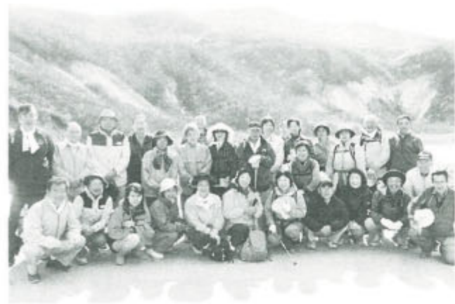
昭和19年の噴火で出来た昭和湖で(軽登山組)