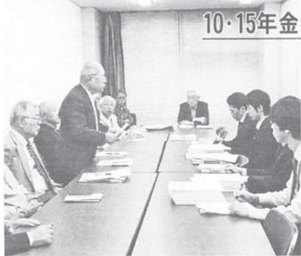
正午からの年金者一揆に先立って厚労省交渉を行った(10月15日)

度度3点。交渉では、この夏多発した熱中症や所在不明の高齢者問題などの例を示し、行政の責任で高齢者の置かれている実態の調査と緊急の支援策をとるよう求め、また、厚労大臣や政務三役との直接懇談を求めました。