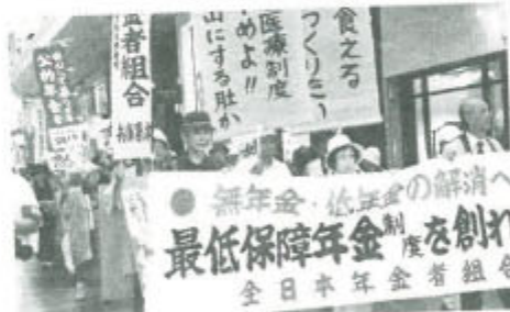
▲神戸市内で兵庫県集会