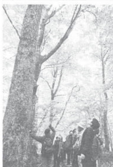
見上げれば黄金色のブナの森