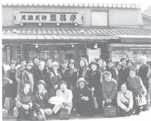
「毎年恒例に」の声も出た落語観賞でリフレッシュ。名称どおりの元気の会のみなさん。

代表者は若干手間とったものの部長を決め、満場一致の祝福の拍手で島根県本部女性部スタートでした。(福岡 葵)