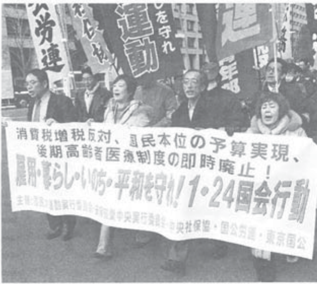
国会請願デモ(1月24日)

第177回通常国会が などの共同で国会請願デモが開会した1月24日、国民モが行われ、約200人が参加、年金者組合中央大運動実行委、安保破棄が参加、年金者組合中央本部、同東京都本部から