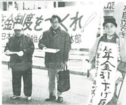
(上) 厳しい寒さをついて「年金引き下げ撤回を」と街頭署名する青森県本部と東青支部(12月22日、青森市内で)

(左上) 年金引き下げの動きに抗議し、年金者組合は財務省と厚生労働省に緊急要請行動(12月24日)