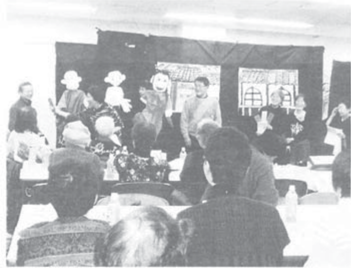
新春のつどいに76人が参加

し最後まで付き添う」ことです。同時に、第三者委員会の作業の仕方が今のままでいいのか、疑問です。 Q 公的年金の受給者・加入者はどのくらいいるのですか。 A 年金受給者は、増え続け3593万人、加入者は減り続けて、はじめて7000万人を切り6936万人となっています(厚生労働省資料)。 加入者減の数字に、雇用問題の深刻さを感じます。高齢者は、所得の全額を公的年金から得ている人が61.5%、年収300万円以下の方が81%で貧困化が進んでいます。 2011年2月5日 (年金相談室 阿久津嘉子)