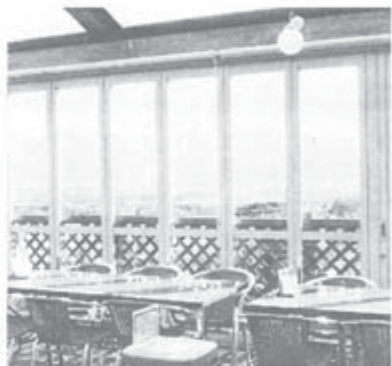
みはらしファームのレストラン