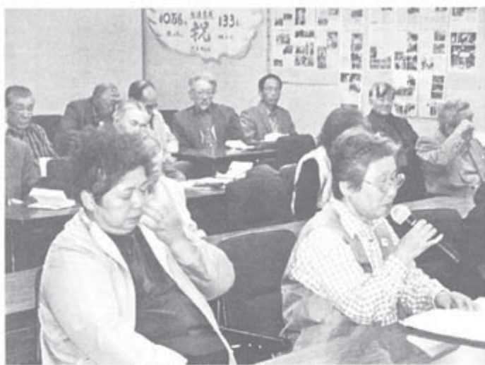
手間どっただけでも話しあいをすすめて喜びと祝福の拍手で結成した島根県本部女性部

県本部第16回定期大会 県の1つである島根でも、当時女性部のない4 早急に結成する方針を確