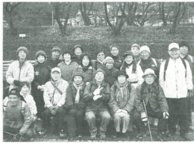
今年も元気に目的地に到着

「元日ウオーク」 恒例の元日ウオークは、6組のカップルや未加入者を含め24人で行いました。