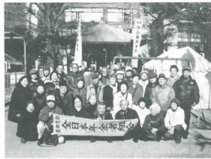
支部の七福神めぐりで毎年30人前後が交流

下谷七福神まで は地元墨田めぐりでしたが、浅草、日本橋、深川、そして今年の下谷と9回目です。