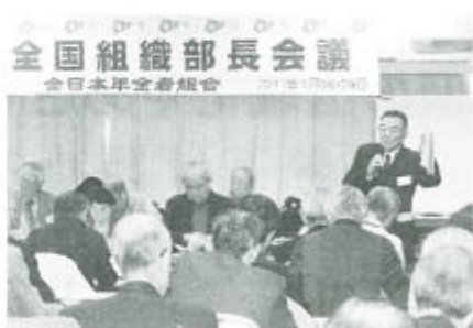
全国組織部長会議 全日本年金者組合

年金者組合中央本部 活とかけ離れている」 は1月28日、抗議声明を発表し、「年金引き下げの根拠としている物価指数は、高齢者の生活と景気悪化を深刻にする」政府は値下げ発表を直ちに撤回し、2000年〜2002年の例にならって凍結すべき」と求めています。