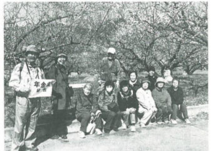
紅梅、白梅、しだれ梅の中を1万5千歩!