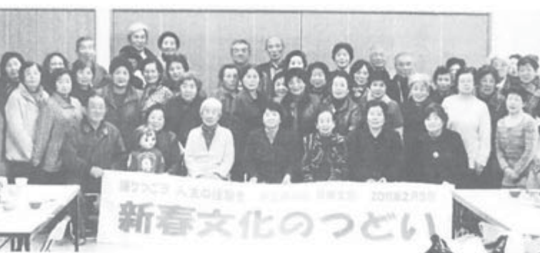
新春文化のつどい

それがそれぞれの思いをもって時代を見つめた作品が並びます。特定の人による選抜(入選・落選)がないこと、鑑賞者と共感し合うことで「質の向上」と「新たな価値」を求めていくアンパン展の形式は、自由な表現を保障していく上で大きな意味をもちます。