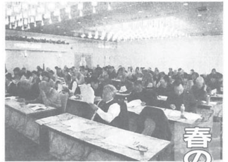
87人が参加した北信越ブロック交流集会 2月28日～3月1日