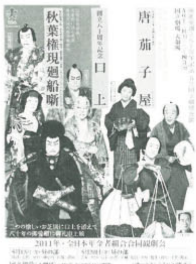
2011年、全日本年金者組合合同観劇会

芝居に恵まれ、ゆかりの地で事前の見学会を開いたりした結果、かなりの動員力を発揮してきました。