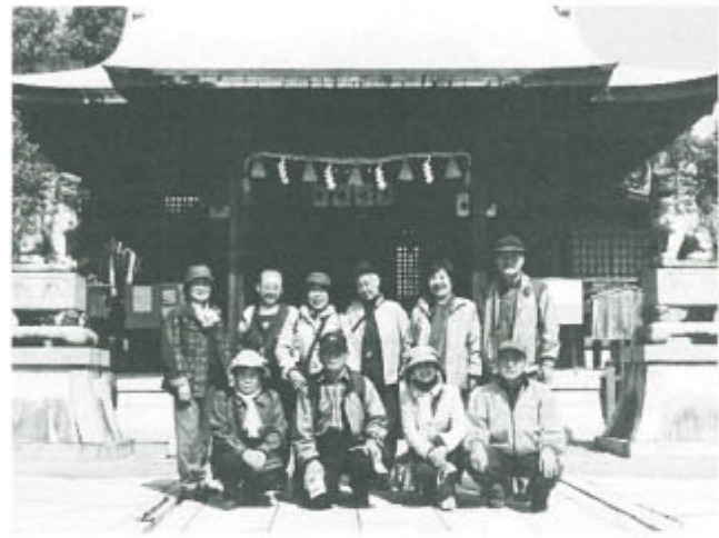
暖かな日ざしの中で久しぶりの「遠足」。