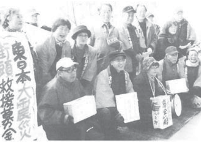
和歌山県・募金活動