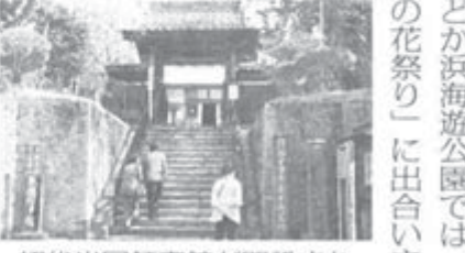
初代米国領事館が開設された玉泉寺