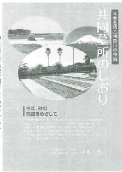
神奈川県本部が制作したパンフレット

に開始し、4月末までに200人をめざしています。建設地は横須賀市の「南葉山霊園」です。アクセスがよく、元ゴルフ