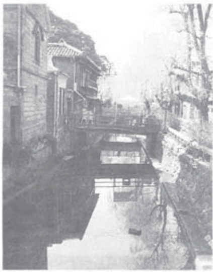
ペリーロードに沿ってなまこ壁の建物が

るキャンディやショートケーキ、ドーナツなどお菓子が風車で作られていました。幼稚園児から小学生、高齢者が風車を作った市民参加の祭り。古い歴史の中に新しい祭りがうまくとけ込んでいました。(家城 健一)