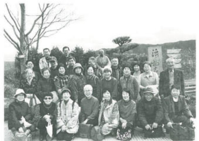
菜膳料理の後、紀伊山地の龍門山を背に