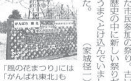
「風の花まつり」には「がんばれ東北」も