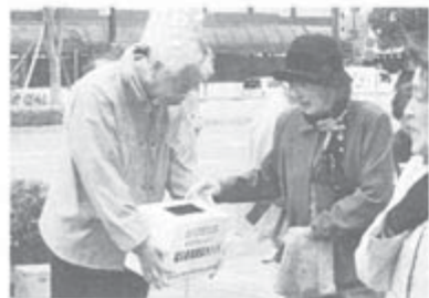
和歌山県本部、和歌山、海草支部は3月25日、和歌山市駅前「東