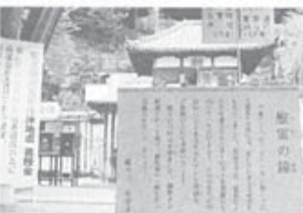
東日本大震災の「慰霊の鐘」