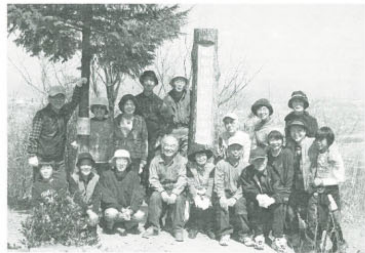
313.5mの鳩吹山で。小学生も2人参加

4月13日、米子市湊山公園で20人が桜花を楽しまました。花は満開、時折吹く風には花びらも舞い、宴が進む中での歌声は子供連れのグループも巻き込み、楽しいひととき。 (立林央士) 被災地の仲間を思っ