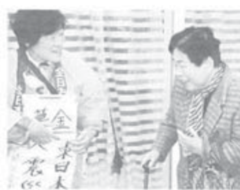
募金を呼びかける兵庫支部の職員

兵庫県本部と神戸市内の支部が3月23日、繁華街で募金を呼びかけました。兵庫支部は15日に地元商店街で年金者組合