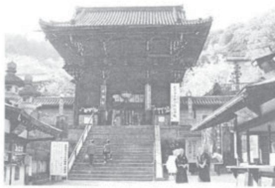
千年の歴史をもつ長谷寺の仁王門