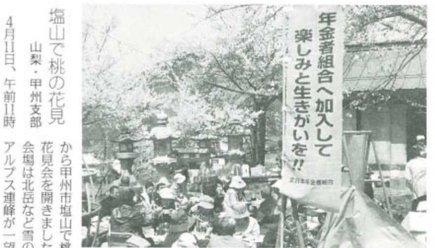
桃の蕾みがほころび、新ノボリ旗も映えて

吹山登山と麓に群生するカタクリの花の観賞へ。登山の後には古城跡も見学。(山本純司)