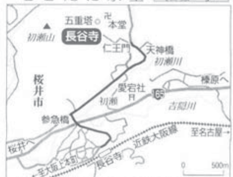
奈良からは乗り換えで1時間前後。長谷寺駅から徒歩20分