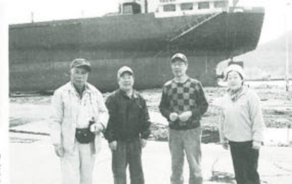
左から本部長夫人、副委員長夫人、部長夫人、柳沢副委員長夫人(背景にあるのは陸に打ち上げられた船)

各県から被災の状況が、出され「原発事故で深刻な事態が続いている。新支部結成を準備中の地域が被ばく対象地になった。4月の執行委員会は