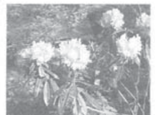
境内は花で埋もれる

鄙びた雰囲気の家家の間を縫い、狭い階段や細い道をくねくねと下りながらこの道でいいのかわと不安になる。長谷寺駅前の「長谷詣へ」の大きな地図に導かれてきたはずだが、ちょうど出会った人に確認しつつ初瀬街道へ出る。