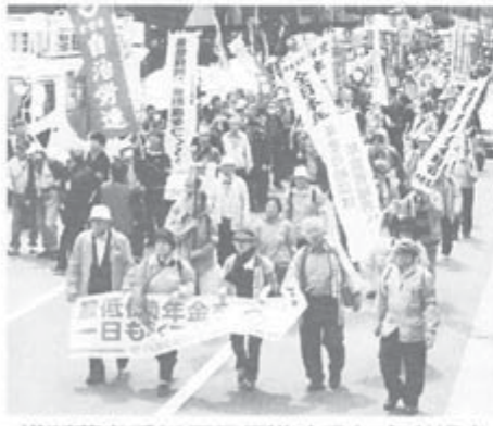
横断幕を手にデモ行進する年金者組合