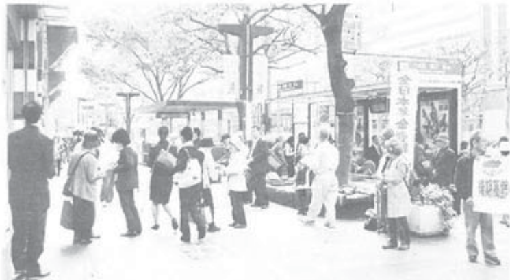
福岡市天神で街頭宣伝

子ども病院を人工島ではなく現地を含めた適切な場所での建てかえ、ユネスコ学習宣言に立ち、生涯学習の場である図書館の増設を。市の児童館は、一カ所のみ。これを各区に作る。市営のスポーツ施設・スケートボード場・ダンスなど無料で使用できる施設をつくること。