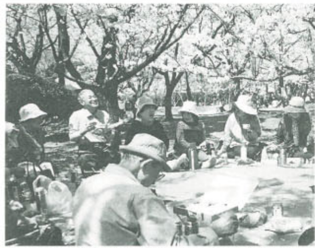
花も舞う楽しいひととき仲間も1人増えました