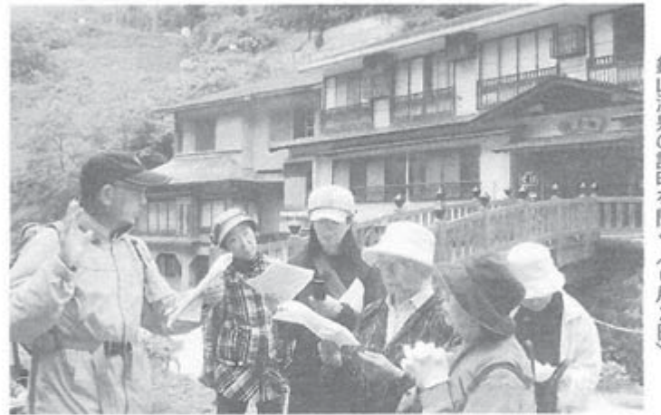
銀山温泉の説明を聞く(6月2日)