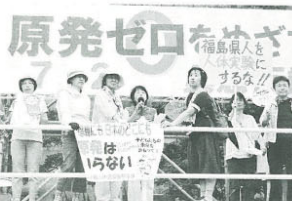
7月2日、東京・明治公園には約2万人が集い、年金者組合員も大ぜい参加した。写真は「原発ゼロ」を訴える被ばく地福島県のお母さんたち

イタリ アの国民 投票は原 発復活反 対が94 %、スイ スもドイ ツも脱原発を表明、日 本の世論は原発の削減 廃止が74% (朝日)と 報じた●3月11日の原 発過酷事故の発生は全 世界を震撼させ、30 以てはもとより全国を 不安と恐怖におとし れた。今も新しい放射 能汚染のニュースが後 を断たず、その広がり は計り知れない。今こ そ原発に頼らないエネ ルギー政策に切り替え る時●しかし政府は安 全を確認し原発路線を 続けること世界に表明、 財界も脱原発の意思は ない。東電は原子力損 害賠償法の免責の解釈 もあると、賠償の支払 いを伸ばす一方、原発 を止めたら料金が千円 上がるかと脅迫している ●第20回大会は6年で 20万人の組合づくりを押し 出した。半年かけて 全支部で方針化する。 「社会保障と税の一体 改革」を阻止し、エネ ルギー政策の転換を求 めるなど、この国のあり 方を変える運動の一 翼を担う立場で支部論 議を求めたい。(田)