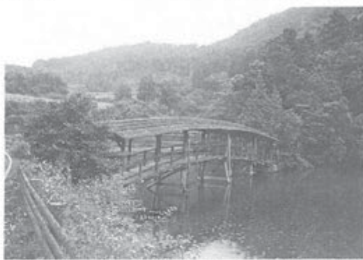
太鼓橋は日本百名橋の一つ。今は虫が美しい

山里の川に架かる屋根付き橋の写真。それは、まだ行ったことのない遠い場所からの誘いのようでもあった。