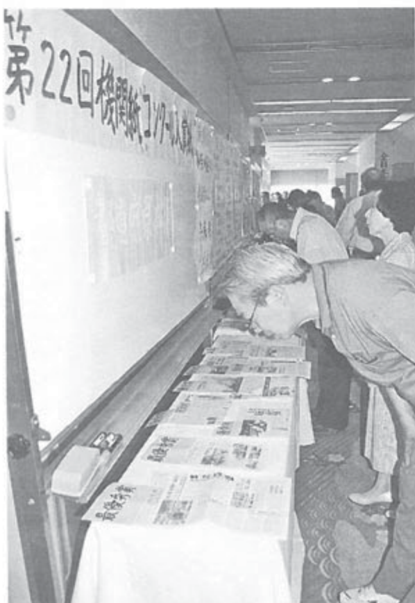
入賞作品を見る大会参加者たち

つばやきを代弁する機関紙 大震災被災地だけでなく、どの機関紙も被災者支援、復興支援を訴え続けています。特徴的な点は、支援活動の報告だけではなく、被災者に寄り添って政策的な提起をおこなっている機関紙が多