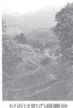
付近は町の景勝地