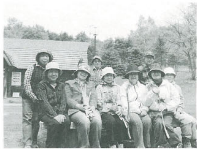
今回は低山ハイキングをとの声も