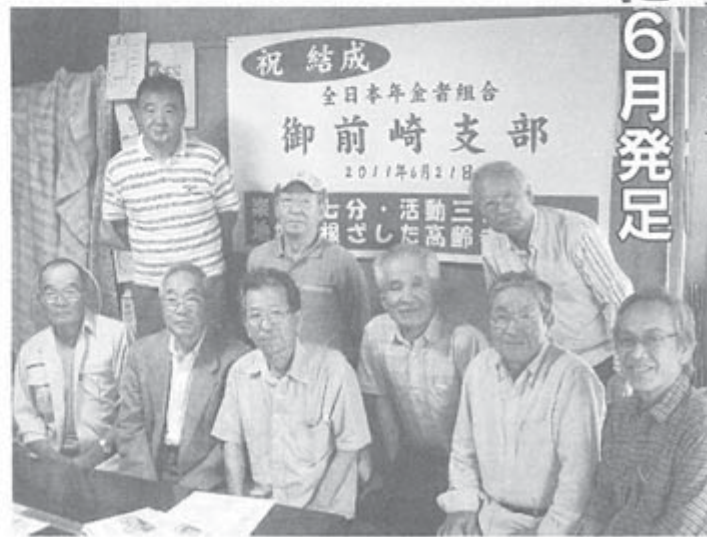
反原発運動の盛り上がりの中期待高まる(6月21日)

支部の代表は早急に決めることになりました。近隣の5支部からも応援に駆けつけ、支部活動の事例など紹介してくれました。当日参加できなかったもの、あと数人にも呼びかけており、反原発運動の盛り上がりの中で、年金者組合も大きく発展することが望まれています。(静岡県本部)