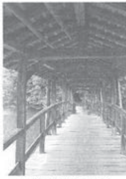
屋根の下は木のぬくもりが

た、天神社の参道のロケ地にもなった。さて、石畳地区で待つお参りする人や道行く人が雨露をしのげるように屋根が付けら