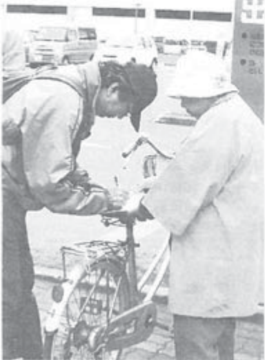
署名を集める組合員

6月15日(水曜日)の年金支給日、三光町ステイ隣の郵便局前で、全道統一行動として、12人が参加して署名活動を行いました。宣伝は、「怒」のむしろ旗を立て、「国と東電は今すぐ補償を」の横断幕、4本ののぼり旗をかかげ、チラシを配布しました。「年金額の削減反対、消費税によらずに、現在の無年金・低年金者に適