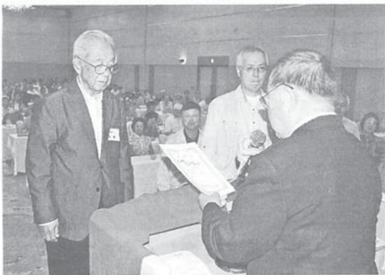
篠塚委員長から表彰を受ける神奈川(左)と兵庫(右)の代表

3月に発生した東日本大震災直後、「こんな時だからこそ機関紙を発行しました」と被災地支部から機関紙が送られてきました。 津波で家と家族を失った組合員からは、「機関紙をもうすぐ発行したい」との連絡もありました。機関紙で仲間をつなぐ