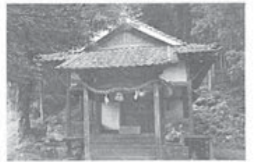
橋の先は弓削神社

れたとも聞いた。風雨から橋を守り、長持ちさせるためとの説もある。いずれも橋が架けられた年代は定かではない。