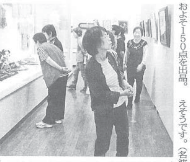
51人から150点が出品され、約300人の来場者で好評でした

何でも手作りで、貧しかった時代を、皆でワイワイ言いながら切り開いてきた私達である。だからこそ今、あの「カリバン魂」をもう一度!と、広く江湖の元カリバニストたちに呼びかけたいのである。新しい時代を切り開くために!