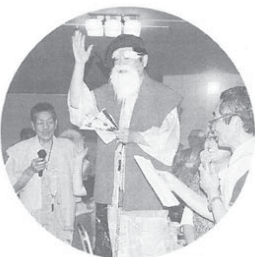
夕食交流会の席で愛知のみなさん

「女性の組合員が少ないので、支部の役員を引き受けて女性に働きかけるようにしています。成果が上がっています」と話しました。