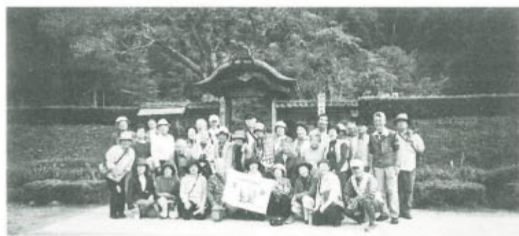
朝倉氏遺跡の唐門前にて

初秋の高原満喫 大分県大分支部 9月27日、18人で久住高原から飯田高原へバスハイク。尾花や萩の花に迎えられ紫色のげんのしょうこが咲き乱れる野原で昼食。午後は自然エネルギー・地熱を利用した八丁原地熱発電所を見学。発電能力11万キロワットで3万5千戸に電力供給可能とのこと。途中、筋湯温泉も楽しみました。(緒方良勝)