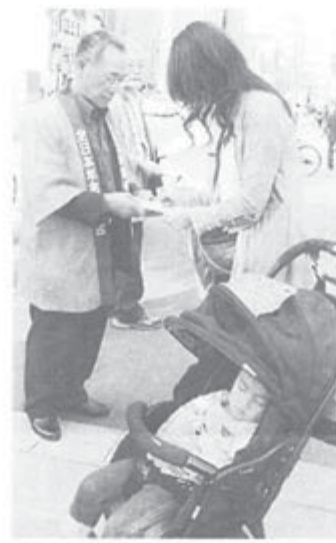
北海道は70地域で決起

一揆をテーマとした踊り を交えての劇などが行わ れ、「税と社会保障の一 体改革」に反対するアビ ールを採択。参加者は ドしました。