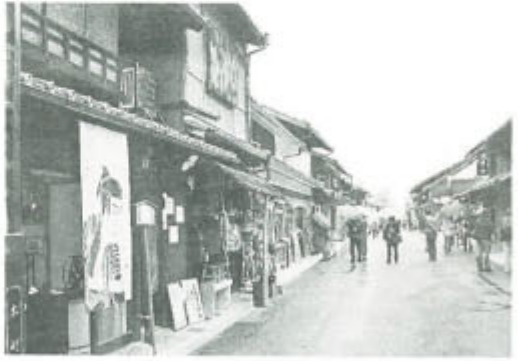
国登録有形文化財の町屋が残る