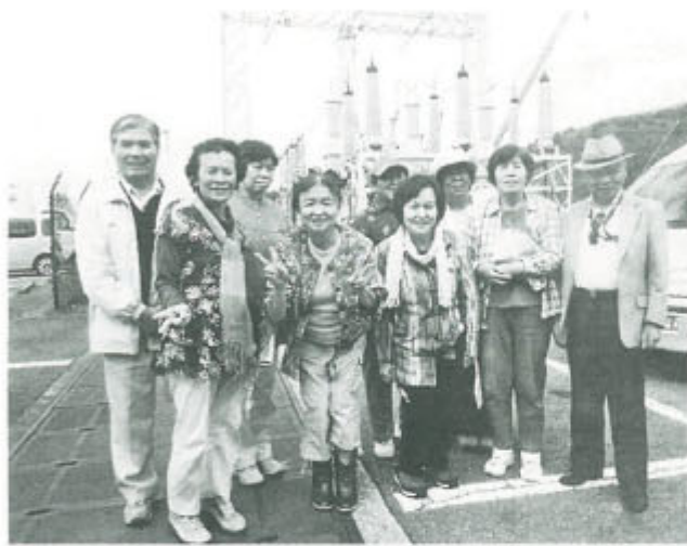
国内最大の地熱発電所で

初秋の高原満喫 大分県大分支部 9月27日、18人で久住高原から飯田高原へバスハイク。尾花や萩の花に迎えられ紫色のげんのしょうこが咲き乱れる野原で昼食。午後は自然エネルギー・地熱を利用した八丁原地熱発電所を見学。発電能力11万キロワットで3万5千戸に電力供給可能とのこと。途中、筋湯温泉も楽しみました。(緒方良勝)