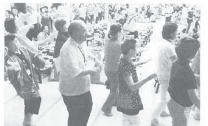
▲北海道女性交流の旅・大広間に踊りのエンドレス ▼新見のうたごえのタベ

北海道本部女性委員会主催の第10回「温泉三昧 花火と湖」女性部交流の旅は9月8・9日、1日目は遊覧船で大自