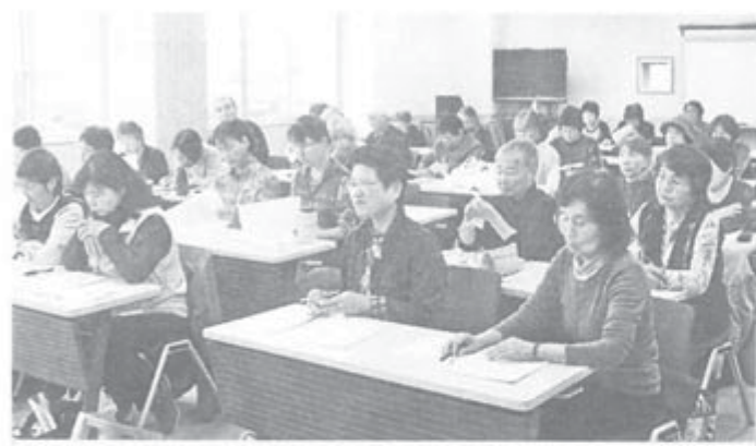
「日程変更を余儀なくされたり、講師に行きづまったりはたばたしたけど、予定を上回った40人参加と嬉しい誤算の交流会でした」と成果の大きかった交流会会場

「来年は大北支部が担当を受けたものの、第7回長野県本部女性部交流会準備は大変でした。」