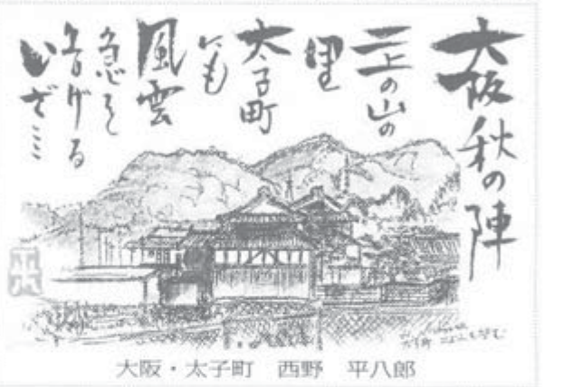
大阪・太子町 西野 平八郎