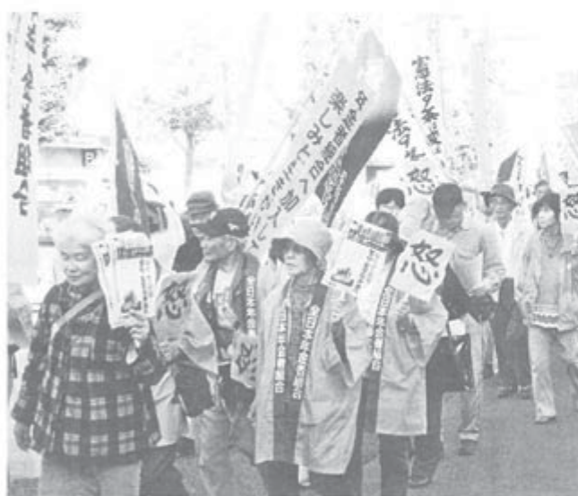
「消費税増税反対」プラカード掲げデモ行進

年金者組合岐阜県本部 つどいを岐阜市内で開 は19日、「つながり」を き、約200人が参加し く深くして、憲法25条を ました。地域からの活動 輝かせよう」と高齢者の 報告や、郡上(くじょう)