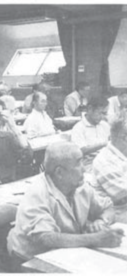
討論で大いにもり上がった会場