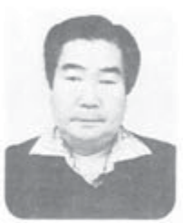
アジア・太平洋戦争

然を満喫、夜は親睦交流会、最後は全員で「故郷」を歌い、「幸せ音頭」で二重の輪となった231人の踊りは壮観でした。2日目の国府前子前中 88円集まりました。