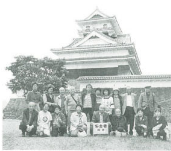
登りが難儀…、記念撮影のみの上山城

北陸のロマン旅 9月25、26日、36人で北陸の歴史とロマンを訪ねる旅へ。福井県の名刹・永平寺を参拝。七堂伽藍に心洗われ、続いて一乗谷朝倉氏の遺跡を見学。復元された町並みで往時を偲びました。石川県の山代温泉で旅の疲れを癒し、二日目は勝山市の恐竜博物館などへ。旅行中に新しい組合員が増えました。(大西健二郎)