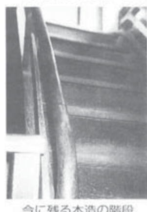
今に残る木造の階段