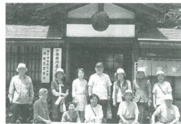
樽平の酒蔵とハーブ園へ 山形・米沢支部

散策。2キロのコースには木道が設置され、散策に最適。瑠璃玉薊や吾亦紅などきれいな花が迎えてくれました。雄花に涼しい風。初秋の風を体感する一時でした。軽い運動の後には、近くの温泉でゆったりと楽しみました。(緒方良勝)