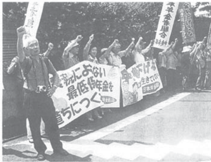
「年金を下げるな これでは生きていけない」と訴える (国会議員会館前・7月18日)