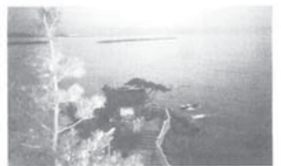
月の名所・桂浜(龍王岬)へも

城は概ね高所に建つ。ちよっとした山登りの覚悟がいるが、ここは広大な公園。城の懐に委ねる