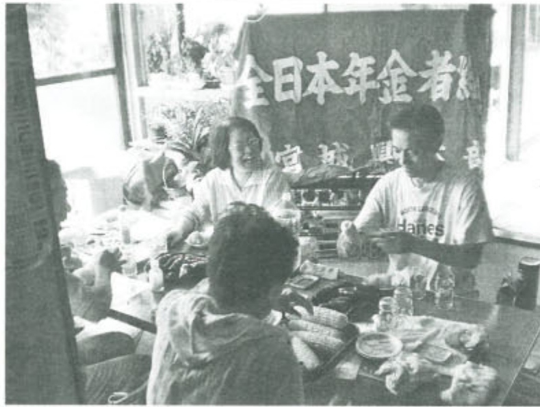
「年金者組合って何するところじゃ」仮設住宅でジャガイモを配りながら交流(7月29日)

7月29日、訪問した石巻市内の追波の仮設住宅団地では、ジャガイモの袋に年金者組合の紹介パンフレットを入れ、30軒ほど配りました。大変歓迎され、「年金者組合って何