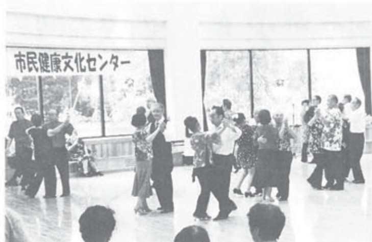
▲市主催のダンスパーティーで呼吸の合ったステップを披露するカップルたち

フランスの核政策を批判した本を出したいから協力して欲しいという。短期間で小冊子が発行され、記者会見。おりしも、会見前日にミッテラン大統領時代の元首相カール氏は無くそう！