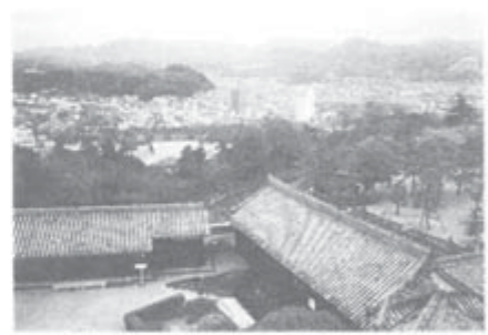
土佐を見下ろす。手前は西多聞