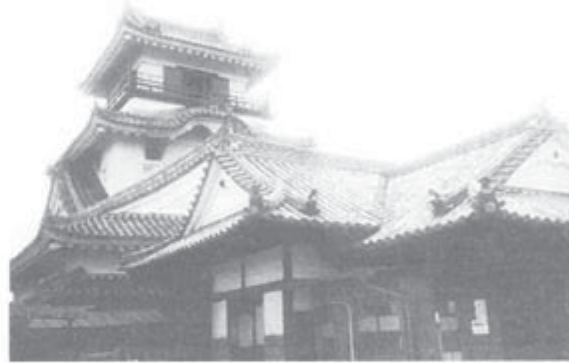
四重五階の天守と本丸御殿