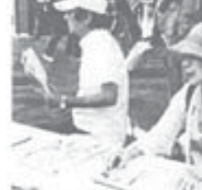
赤羽駅頭での定例行動 (8月24日)

東京・北支部は2カ月に1回の年金支給日に赤羽駅頭で年金引き下げ反対の宣伝行動をし、6月中旬に600署名の目標を達成しました。4月に19人、6月にも17人が参加