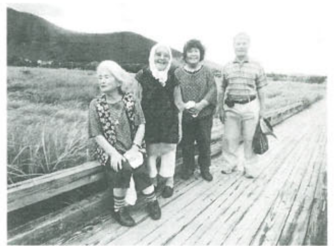
たて原湿原で初秋の風に癒されながら...