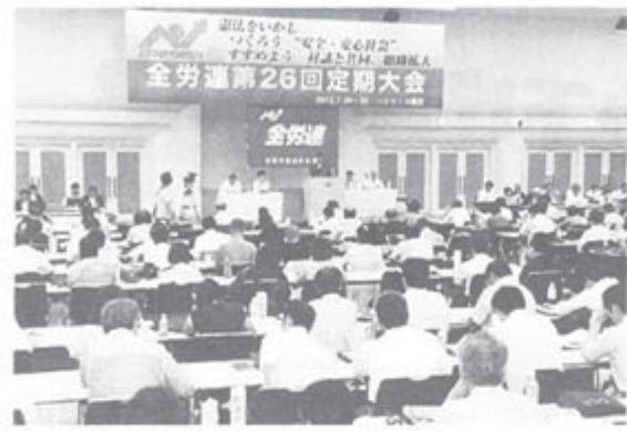
全労連第26回定期大会開かれる

率重視の日本社会からの転換をめざしたたかいで労働組合としての積極的な役割発揮。第2は、働いて人間らしく暮らせる社会をめざす制度改善