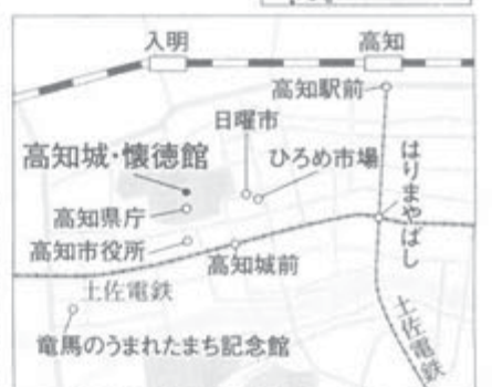
高知城は高知駅前から土佐電鉄はりまや橋乗り換え高知城前下車、徒歩5分。

ようにのんびり散策しながらゆるやかな階段を上れば、小さく見えていた天守に近付いて行く。南国土佐の中心地、高知市の更に中央にある大高坂山の上に建つ高知城。関ヶ原の戦いの功績により土佐一国を拝領し