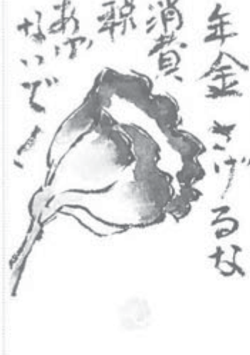
北海道・札幌市 岩淵 敏江