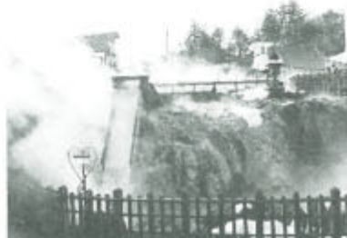
湯けむりを上げるシンボルの湯畑

「草津節」の音頭に合わせ始めた湯もみショー。紺の着物を着た5人の女性が、若い人が多くつめかけていました。 馬場「湯もみ」ショー 若い人に人気 草津観光協会 0279・88・0800 ▼訂正「前号地図内「JRタワー」は「JPTタワー」の、記事「約100年前、赤レンガ駅舎」は「約100年前の誤りです。ちなみに焼失が約67年前