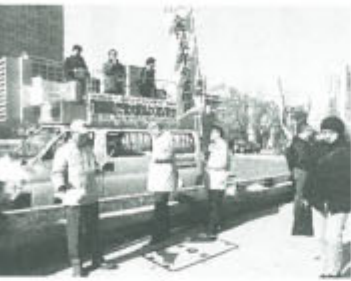
1月24日淀屋橋で、大阪市会臨時議会の開会日宣伝行動が大阪市対策連絡会と「職員基本条例」「教育基本条例」条例化反対連絡会主催で行われ、各民主団体から60人あまりが参加しました。

県の取り組みをふまえ、率直な意見が交わされました。拡大月間の取り組みも、委員長ならではの苦労が語られました。社会保障を切り下げ、軍