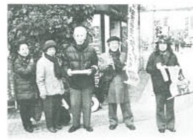
「福岡」寒風について 短時間で50筆 1月24日、寒風の中商店街で署名行動。一般の組合員も多数参加し1時間足らずで50筆以上集めることが出来ました。

「本当に困っちゃう」「頑張ってください」「年金下げてデフレ脱却なんかできない、物価が上がるだけ」と対話も弾み、1時間という短い宣伝行動で34筆の署名が寄せられました。