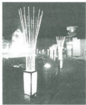
ライトアップされた湯畑