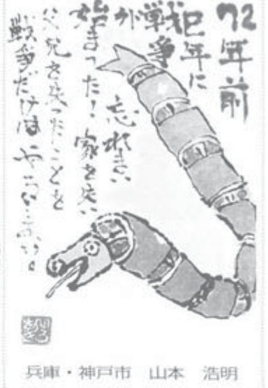
兵庫・神戸市 山本 浩明