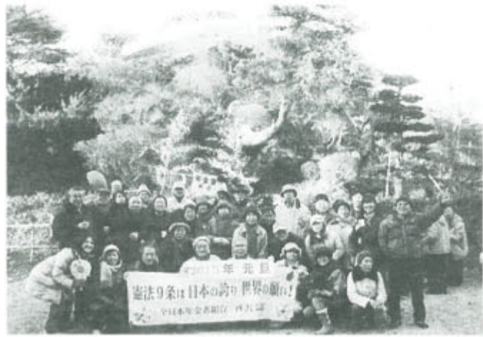
明治17年から15年間かけて築き上げられた荒畑富士で

昨年結成された益城支部は1月6日、益城町のシンボル飯田山へ初詣を兼ねて山登り。植物の説明を聞きながら1時間余り、途中、常楽寺で初詣をして、すがすがしい汗をかきながら頂上へ。できたてのお汁粉や持参のおにぎりでお腹一杯になり、ゲームや歌で楽しい一時を過ごしました。(藤木俊明)