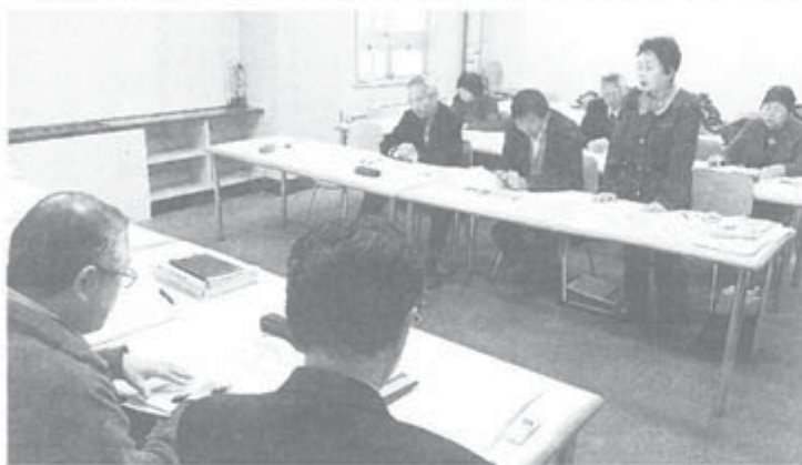
今後も継続することの確認もした懇談でした

神奈川県本部は1月28日、女性の会が昨年発表した高齢女性生活実態調査の結果について、神奈川県高齢福祉課と懇談し、意見交換をいたしました。