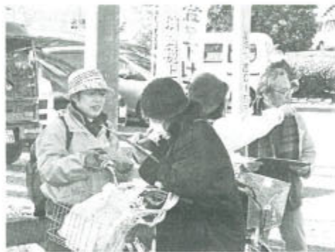
「年金だけしか収入がなく、それを引き下げられると困る」など、多くの人の対話が弾み、と期待の声も寄せられ、多くの人に年金者組合の存在をアピールすることが出来ました。

仲間作りを進めるためにも、年金者組合が市民に見える取り組みをしようという人が多く集まる所へ出かけました。 1月28日に丸子大銅不動尊の縁日に出かけて行き、2・5%の年金引き下げを止めさせる署名を訴えながら、「年金者」の署名が集まりました。