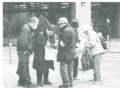
新座支部では1月23日、定例の街頭宣伝、署名活動を行いました。高年齢者にとって年金削減は死活問題であり、消費を一層冷え込ませることになる。また若い人にとっても将来受け取る年金が削減されます。

「凍土を踏みしめ訴え」許すな「年金者のいのちと暮らしを守れ」と訴えました。 名活動を組合員7人が参加して行いました。高齢者にとって年金削減は死活問題であり、消費を一層冷え込ませることになる。また若い人にとっても将来受け取る年金が削減されます。