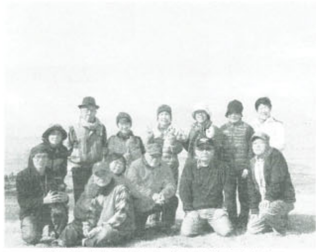
笑顔もすがすがしく、飯田山の頂上から