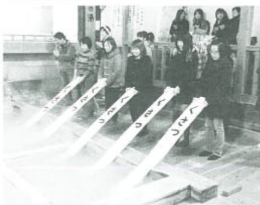
湯もみを体験する観光客