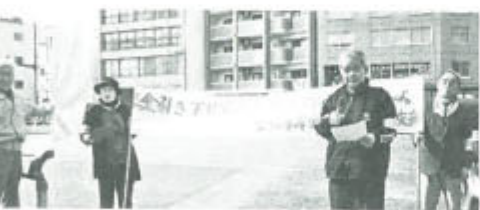
1月9日、下関市役所横で「年金下げるな」組合に加入しよう」のノボリと「2・5%年金引き下げ即時廃止」の横断幕を掲げ街頭署名を行いました。凍てつく寒さの中、参加者9人が「年金者組合」の腕章をつけ「即時廃止」を訴え30分でヒラ約100枚を配り署名62筆を集めました。