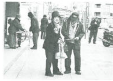
「大阪」橋下市政ノ一で 民主団体共同行動 1月24日淀屋橋で、大阪市会臨時議会の開会日宣伝行動が大阪市対策連絡会と「職員基本条例」「教育基本条例」条例化反対連絡会主催で行われ、各民主団体から60人あまりが参加しました。

岡崎支部は、憲法25条の生存権に思いをはせ、毎月25日を中心に康生町や二七市で街頭署名を行っています。1月25日、9人が参加し、10時から11時で60筆が集まりました。悪天候の中「寒いのにご苦労さん」とねぎらいの言葉もたくさん頂きました。