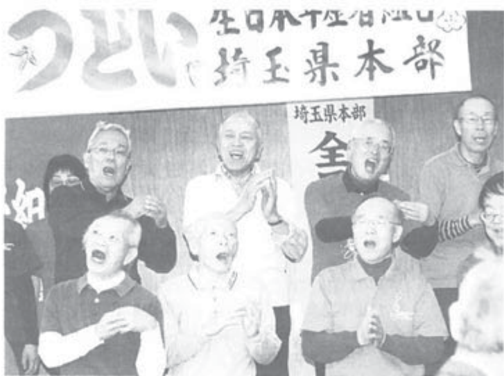
1万人達成を喜ぶ埼玉県本部的つどい