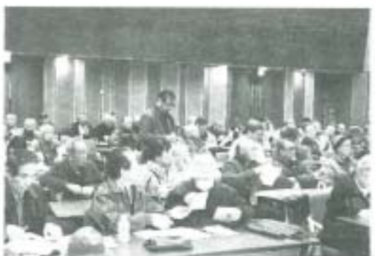
月間は4月、6月20日(第21回大会)まで