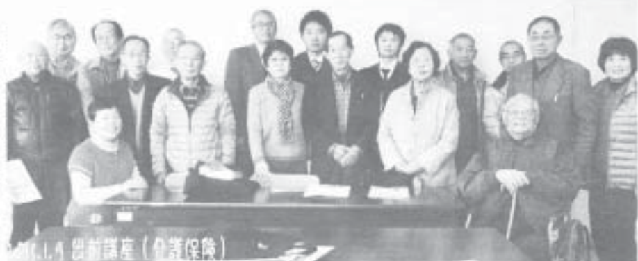
▶「参加してよかった」出前講座

高年齢者の人間的尊厳がしっかりと守られる職場と社会実現のために力を合わせましょう。(注)「高年齢化時代の安全・衛生 労災防止のためのガイドライン」東京労働局労働基準部のホームページを適用しましょう)