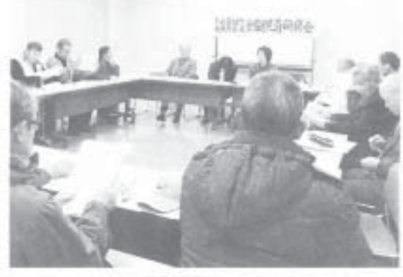
熱気あふれる研修会のようす

《観劇会の担当員》 5月10日 東京、神奈川、静岡、山梨、長野、新潟 5月17日 青森、岩手、秋田、宮城、山形、福島、茨城、栃木、群馬、埼玉、千葉