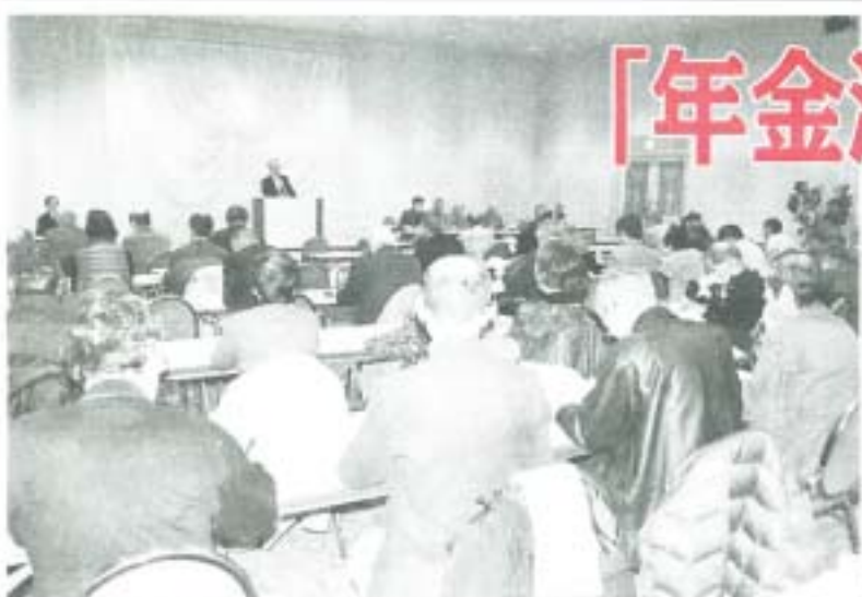
長野県松代町で開かれた北信越ブロック支部交流集会の全体会(2月25日)

〒110-0055東京都豊島区南大塚1-4-15大塚駅前ビル 発行人 篠塚 多助 月刊1部100円(組合費を含む) 昭和57年6月30日第三種郵便物認可