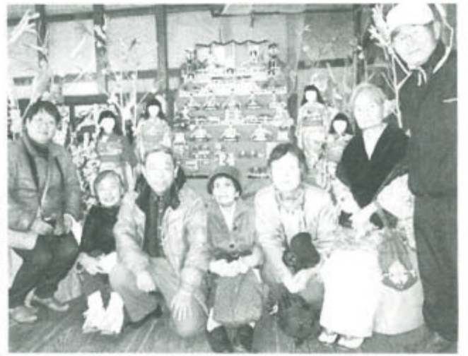
引田飾り(雑飾り)と共に笑顔もゆったり

六義園から巣鴨 東京・北支部 ぼかぼか陽気に誘われて3月7日、美男美女13人、梅が真っ盛りの六義園、巣鴨の地蔵通りを闊歩しました。「新しい仲間とゆっくり楽しめた」「初めての参加でしたが親しみいっぱい、素敵な仲間にも恵まれ楽しい一日だった」「ビールがうまかった。歩き疲れた」などの感想が寄せられました。