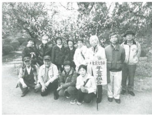
急に春が来たような日に楽しくウオーキング

六義園から巣鴨 東京・北支部 ぼかぼか陽気に誘われて3月7日、美男美女13人、梅が真っ盛りの六義園、巣鴨の地蔵通りを闊歩しました。「新しい仲間とゆっくり楽しめた」「初めての参加でしたが親しみいっぱい、素敵な仲間にも恵まれ楽しい一日だった」「ビールがうまかった。歩き疲れた」などの感想が寄せられました。