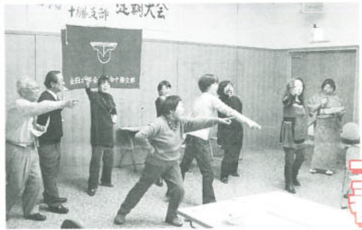
▲定期大会のあとの交流会で振り付けの歌で楽しむ組合員(十勝支部、こしちん支部)

と首都圏年金相談ネットワーク会議が中央労金に要請していたもの。ただし、中央労金の所管地域は関東7都県と山梨県で、ここに居住または勤務している人に限られており、全国の労金での実施が期待されます。