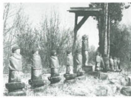
尾根に立つ十三権者の石仏

翌朝、女将さんの「写真撮る方たちが上られるのは4月。同公園に「武甲山資料館」などがある。採掘で失われていく動植物の貴重な資料を蒐集し、全貌を後世に伝えるためという。