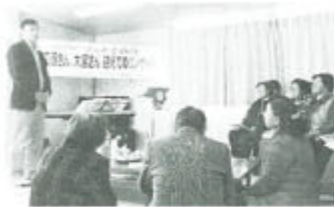
「追波川」と「南境第7団地」の仮設でコンサート開催

2つには、被災地案内を兼ね、一刻も早い公営住宅の建設(石巻はまだゼロ)が再確認され、人を中心にした復興ポイントを見出す貴重な場になっています。