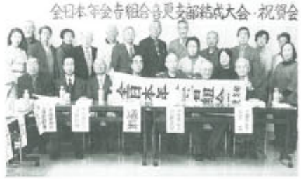
▲音更支部の結成大会・祝賀会(3月20日)

この街宣署名とは別に支部独自にも取り組み、札幌白石支部は組合員一人10筆目標を達成。遠軽支部は3月8、9両日、団地での宣伝署名行動にのべ13人が参加し120筆の署名を集めています。