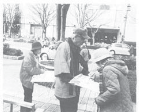
次つぎと足を止めて署名

鳥取県西部支部は3月1日、米子市内のえるもーる商店街で「年金2・5%引き下げをやめさせる」署名を訴えました。