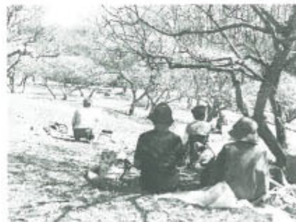
梅園で写生をする人たち