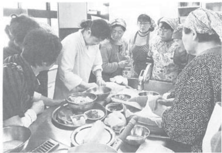
講師の作業を見る目は真剣でした

秋田・秋田支部は恒例の「年金厨房」をこのほどサンパル秋田に22人が参加して開きました。