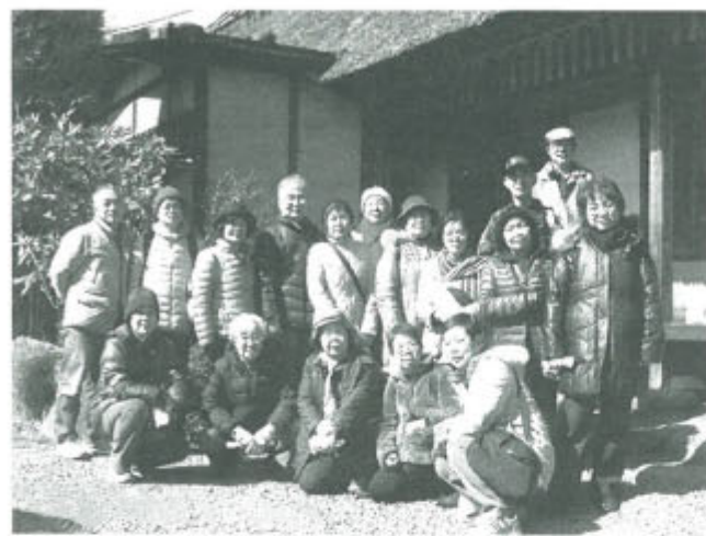
新島襄の旧宅前で記念撮影

引田飾まつりへ 香川・高松支部 国分寺班 3月3日、「引田飾り子供歌舞伎」上演、まつりの楽しみと温泉で湯ったり」に7人が参加。 引田飾まつりは、讃州井筒屋敷で「だんじり子供歌舞伎」を上演、古い町並み70軒以上で