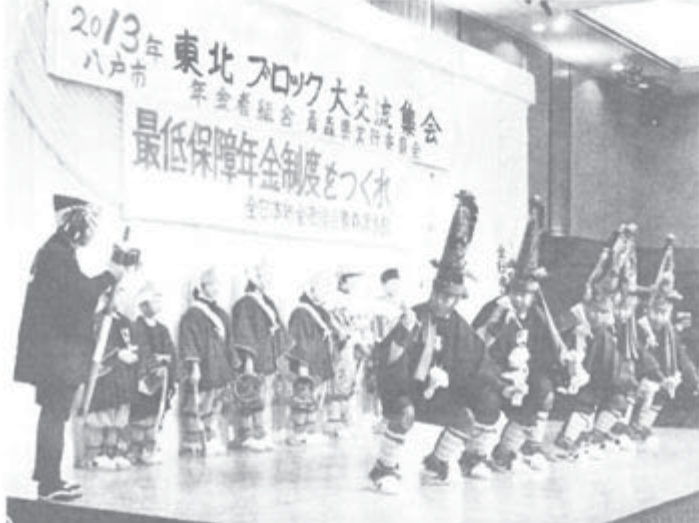
東北ブロック交流集会(国の民俗文化財・八戸えんぶり)

支部結成の3月13日、1人が加入して19人で富山支部から独立。立山町は人口2万7401人、立山は富山支部に長ら