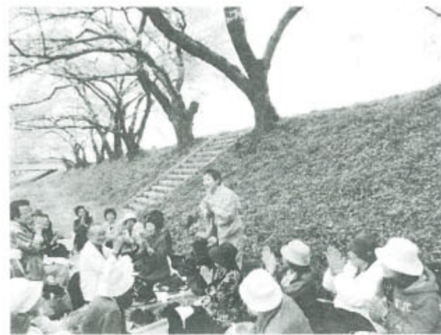
春のほかほか陽気の中で手拍子も楽しく