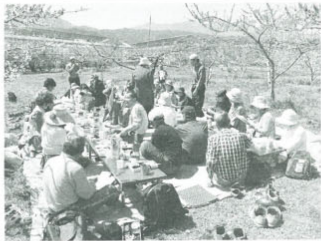
「はーるよらい 桃の花見会」で楽しい一日