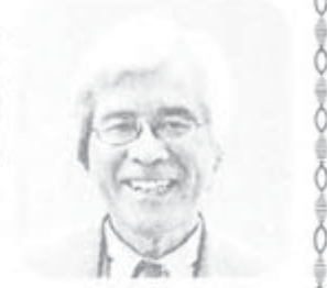
新着映画「リンカーン」は、奴隷制廃止に迫る大統領の心の葛藤を中心に据えた優れた作品となっています。

「アミスタッド」も感動的でした。私は大学の市民講座で「歴史の面白さと恐ろしさ」映画「アミスタッド」を題材として「の話をしました。 「アミスタッド号反乱」事件とは1839