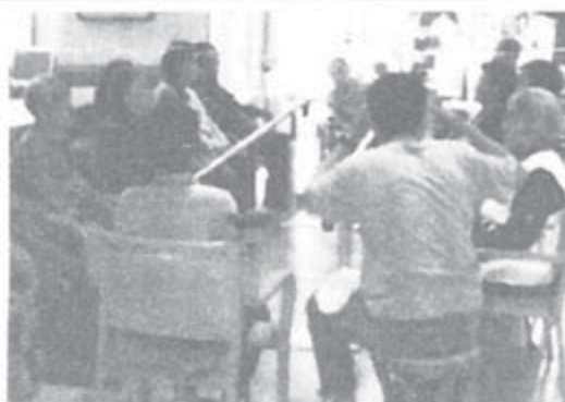
みんな揃って楽しい時間

千葉・千葉市支部協会 生活支援センターからた。性部会はこのほど、安心「生活支援ハウスからして住み続けられるまち」を訪問しました。スライドを使って施設づくりをめざして事業を展開している「まくはり」の説明をうけたあと、グループに分かれて見学。 「グループホームひまわり」は、10人定員の認知症高齢者の共同住宅(個室)を巡り、食事、入浴など生活の介護・支援を受けながら、90歳を過ぎてても明るい方たちに話もろかがいまして、 「生活支援ハウスから」は、日常の基本的な生活が自分でできることが条件。個室で比較的低負担(食事・光熱・共益費5万6千円+無料、最高5万円)で入れる明るい施設です。 昼食中も懇談、「有意義な企画に感謝」「船橋では特養ホームをつくる会の活動で実現できそう」「年金者のグループホームが造れたらいいな」など、話つきませんでした。(鈴木和子)