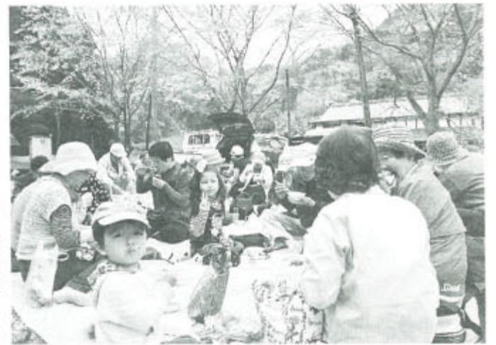
福田桜や七福神桜の下で手作りの味は格別

山梨・北杜支部 待ち遠しい春。北杜支部初めてのレクリエーション企画は南アルプス支部との交流を含めて4月9日に実施。北杜から33人、南アルプスから7人が参加。桃の花、空の青、真っ白な富士山、そよぐ風。開放気分以自己紹介。南アルプスの皆さん、準備ありがとうございました。(岩倉 博)