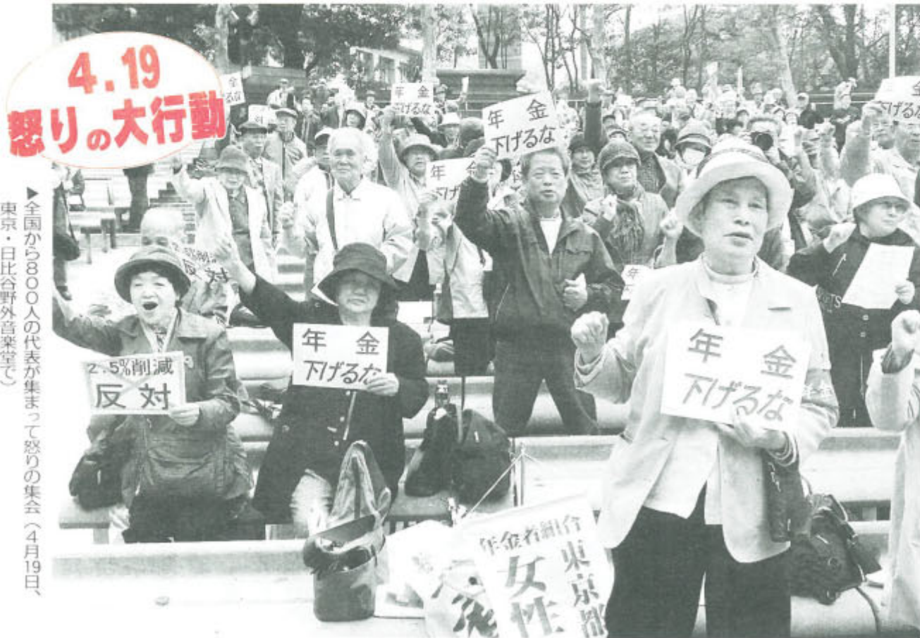
▶全国から800人の代表が集まって怒りの集会(4月19日、東京・日比谷野外音楽堂)

〒170-0005東京都豊島区南大塚1-60-20天翔大塚駅前ビル 発行人 篠塚 多助 月刊1部100円(組合費を含む) 昭和57年6月30日第三種郵便物認可