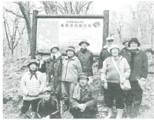
湿原を歩けば水芭蕉以外の花の群生も