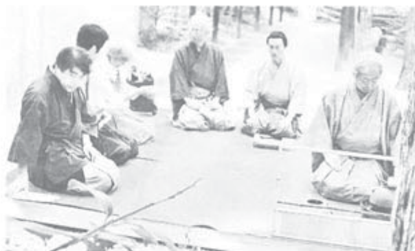
男性スタッフがすべて請負った野点席。茶会へ参加も多数あり、これからの活動が期待されます。大茶会は、10月に開催予定の「結成10周年記念講演会・交流会」の一環行事です。(佐藤征司)

その三。世の反動勢力と闘われれば強力な武器を手に入れることに気付こう。民主主義である。これは戦前には持っていなかった、持とうとした人は残らず犯罪者とされた自由である。いまわれわれはそれを持っている。反動勢力さえも、その中身はインチキながら自らを「自由民主党」「民主党」「みんなの党」などと標榜せざるを得ない、いまはそういう時代なのだ。自信を持とう。