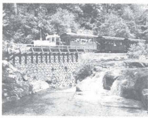
初夏の陽をあびて溪流を走る赤沢森林鉄道