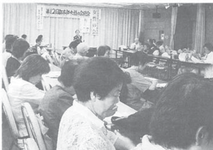
「選挙で悪政の流れを止めよう」と学習。

東京都本部女性の会は5月27日、第12回総会を豊島労働福祉会館に101人が出席して開きました。