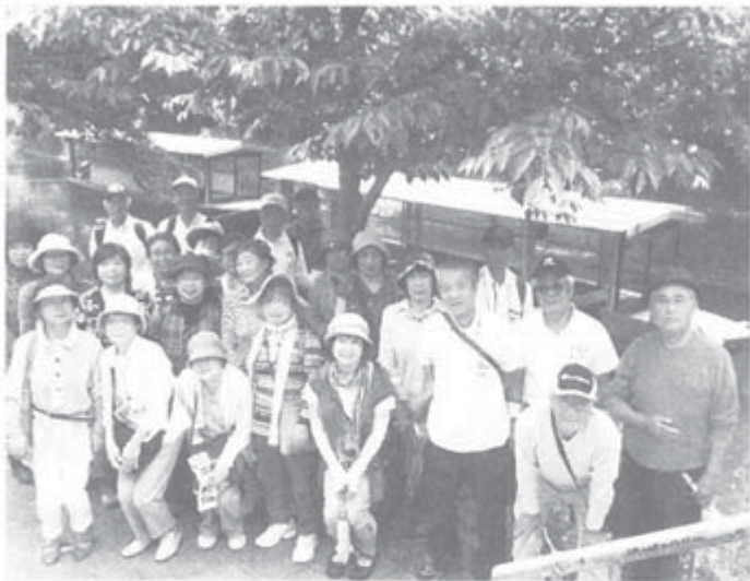
京都伏見より十石船で川下り(交野支部・テクテク会)