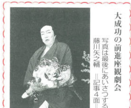
大成功の前進座観劇会

委員会は、国の年金制度のなかに最低保障年金を導入することを求めた前回の勧告を繰り返す。委員会は、また、締約国が生活保護を申請する手続きを簡略化し、申請者が尊厳をもって対応されることを確保することを呼びかける。委員会は、また、生活保護についている恥辱感を根絶する目的で人々を教育することを勧告する。委員会は、締約国が、次の報告書のなかで、被爆者を含む高齢者の状況、性による差別の状況、所得の源泉と水準に関する情報を提供することを求める。(以下、略)