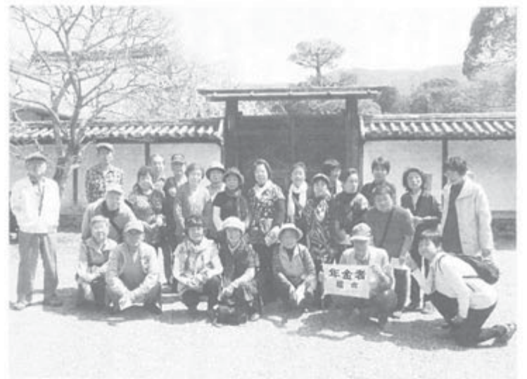
京都の桜見物日帰りバス旅行(2013.4.4)

福島県本部の白川支部からこの3月に、3つの支部が分離独立しました。矢吹支部35人で発足。24日、矢吹町に「矢吹支部」として発足。男性21人、女性14人計35人。人口1万8千人、高齢者比0.4%、県内で2番