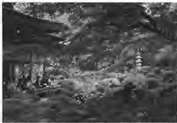
大原は三千院(聚碧園・有清園)もよく知られる

紅葉の季節だというのに相変わらずここは静かだ。本堂の前で祈る女性がただ一人いるのみ。落ち葉を踏みしめる音で境内に人の入るを知る。 「大原問答」の舞台で知られる勝林院。法然上人を招いて諸相高僧が宗論したという。本堂に安置される本尊阿彌陀如来像からは五色の綱が下がり、人の触れるのを待つ