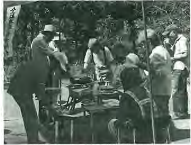
100回目は石巻山の麓の池の辺にある庭で