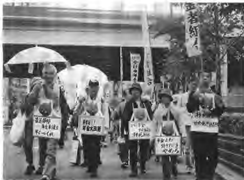
年金者一揆で要求かかげデモ行進する参加者(10月18日)

2.5%の年金引き下げは、12月支給分1%からすでに始まっており、全組合員参加を目指す「不服審査請求運動」は、重要な段階を迎えています。2.5%の引き下げ、すなわち「物価スライド特例分」の解消は、単に2.5%の削減だけの問題ではありません。それは、「マクロ経済スライド」を働かせること、つまり連続した年金引き下げに道を開くものです。