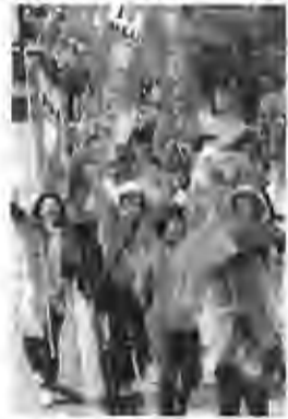
大阪堺市長選のパレード