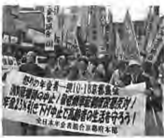
怒りの年金者一揆10・18京都集会 「消費税の引き下げ中止/消費税増徴反対/年金2・5引下げ中止で高齢者の生活を守ろう!」 日本年金者連合会京都本部

宮城の 復興住宅 はまだ一 戸も建っ ていません。人のいない 地域に高さ10メートル、 長さ360キロに及ぶ堤 防が1兆円かけて造られ ています。南三陸全体を コンクリートで囲んで、 豊かな自然を破壊する、 このようなことは許せま せん。