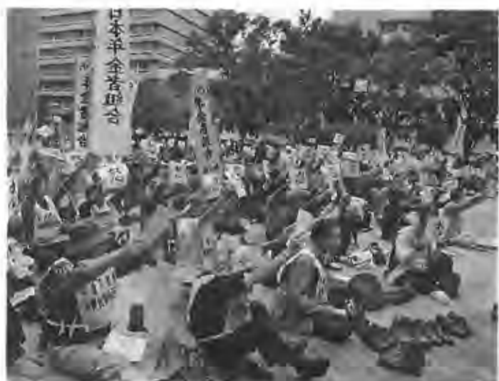
「怒」の文字のプラカードを掲げて決意を表す参加者(愛知)

満宮で宣伝、また、「四条 通作戦」として四条河原 町、四条烏丸、四条大宮、 西院で一斉に宣伝しまし た。当日は、円山野外音