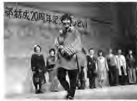
(右)拍手する参加者 (上)着物リメイクのファッションショー

大阪府本部では女性部結成20周年行事をひとつの節目に取り組もうと、活動の合間をぬって実行委員会を開き1年前から準備しました。10月16日、「20周年記念のつどい」は35支部1