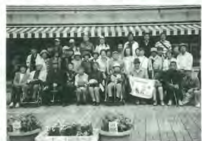
郡上八幡と黒部溪谷へ 京都・左京支部