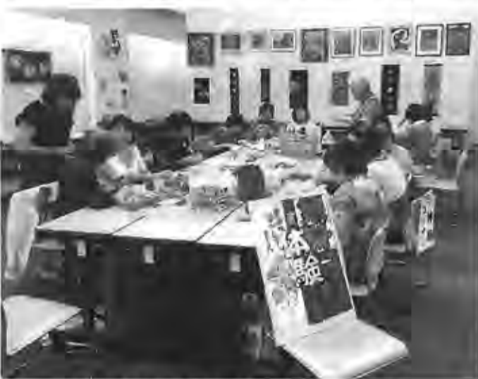
15種類の手作り作品に刺激されて無料体験コーナーも賑わいました。

北海道・苫小牧支部は、けた「第3回元気な高齢者小牧市文化振興事業の者の手作り作品展」を8月27、29日に開き、のべ