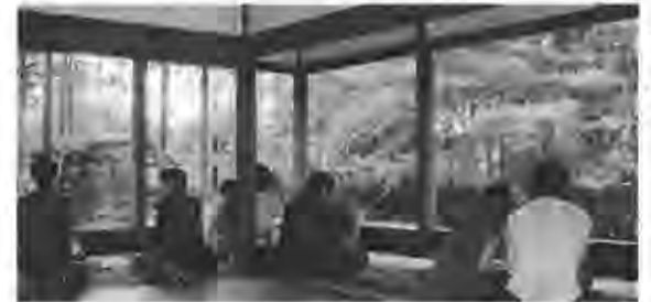
血天井と額縁庭園のある宝泉院

ように揺らめいている。多くの見どころが点在する古都京都。折々の季節により訪れたい場所も変われば、何度も足を運びたい土地もある。 観光客で賑わう市街地とは対照的に、山と田圃に囲まれた大原は、バスを降りて寺院を巡る人々に季節の移ろいを余すところなく差し出してくれる。木々が色づく時季に思い出す土地の一つだ。 勝林院南の実光院は勝