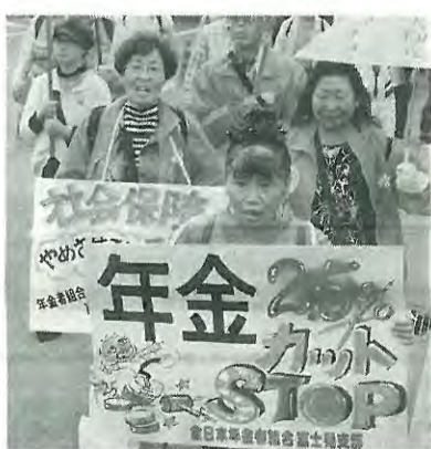
東京・銀座に行くデモ参加者

なかで秋の仲間づくり月間を成功させ、仲間の輪を広げながらたたかうとの宣言を全参加者の拍手で採択。集会後、銀座をデモ行進し、年金引き下げ反対、消費税増税ストップ、原発再稼働反対、被災者救援などを訴えました。