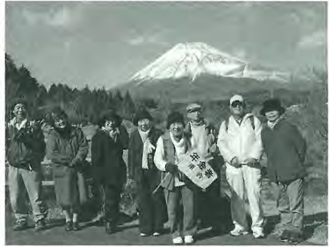
天候に恵まれて富士山くっきり