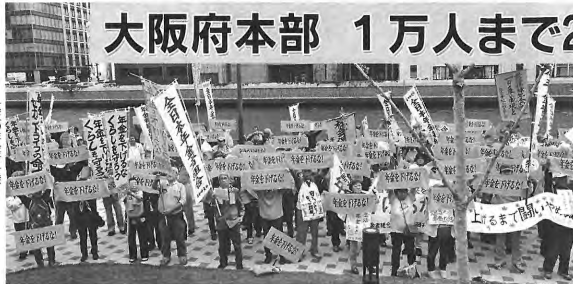
大阪の年金者一揆

大阪府本部は、11月12日に開いた支部代表者会議で、様々な困難を突破して1日も早く1万人組織を達成しようと思慮統一しました。秋の仲間づくり月間に入って100人以上を増やし、現在9837人と残りがすでに200人を割っています。