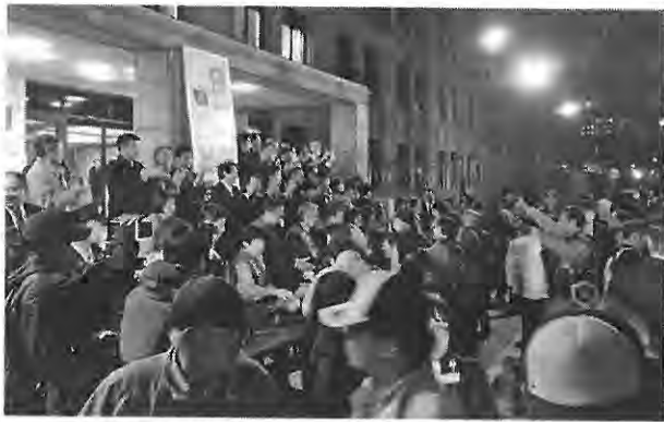
デモのあと国会誓願する参加者たち

「STOP! 『秘密保護法』大集会」が11月21日、東京・日比谷野外音楽堂で開催され、1万人が参加。年金者組合も中央本部、首都圏などから多数が参加しました。