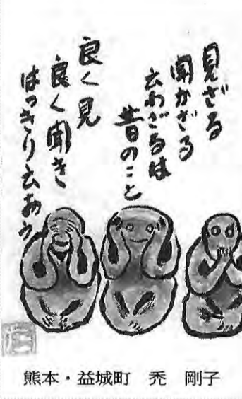
熊本・益城町 禿 剛子