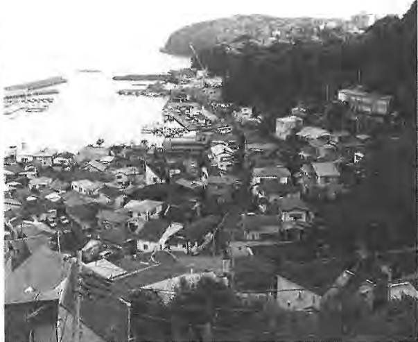
真鶴半島(写真奥)と真鶴港