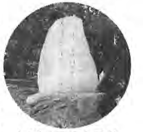
与謝野晶子の歌碑