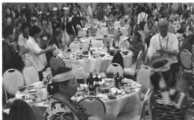
259人が輪になって「幸せ音頭」で会場一周