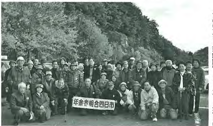
年金者組合四日市