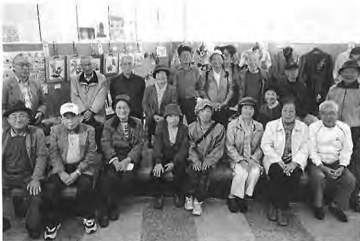
文化作品展を成功させた伏見支部の仲間たち

この作品展会場で3人の加入がありました。5月から作品展までに32人を迎えています。11月中旬には大運動会を開き、健康的な支部と、たくさん仲間をつくる決意です。