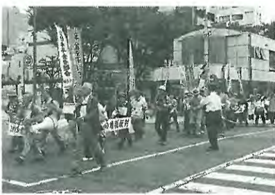
広島市内をデモ行進する年金者一揆(10月18日)

支部のない地域に広げている県役員の女性は「知人、友人に意義を話して、回りの人に広げてもらうよう170人依頼した。あと60人にはお願したい」と述べました。