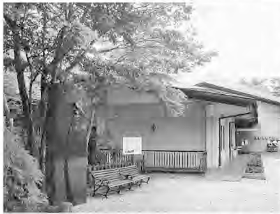
宮沢賢治記念館と「よだかの星」彫刻碑