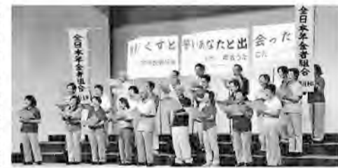
奨励賞を受賞した「年金うたごえ藤枝」

「プラボー、会場内が 一体になったね。『戦争 なくすと誓いあなたと出 会った』年金藤枝素晴ら しい。『ビゼーの』『小