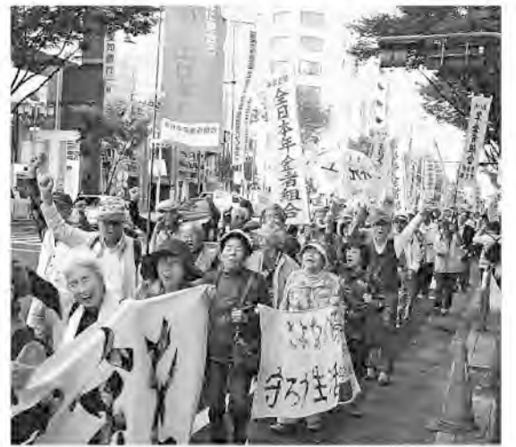
名古屋の中心街でアピールする愛知の一揆