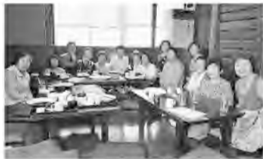
誕生を祝う食事会