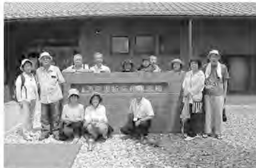
伊那谷南部に建つ満蒙開拓平和記念館

8月7日9時、12人が 労金を出発。毎回のこ と、車中の会話が楽しい ので運転も苦にならない。 うっかり迷いそうなら 開拓民27万人を県別一 覧でみると、長野県がダ ントツだ。なかで も伊那谷南部の 村々の移民率は異 常に高かった。当 館は様々な意味を 含んで、象徴的な この地に建てられ ました。