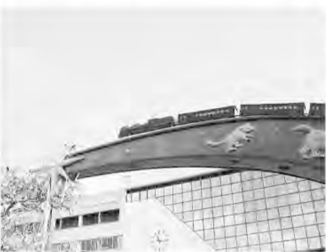
新花巻駅の「銀河鉄道の夜」碑

方があるらしい。イーハトヴ。賢治は岩手県を理想郷の名で呼ぶ。子供に戻って無邪気に遊ばば、不思議な