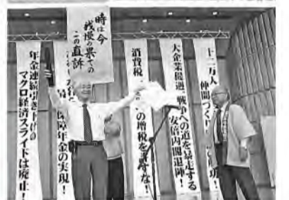
むしろ旗川柳で最優秀の表彰を受ける