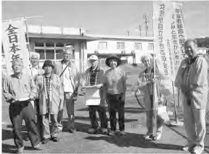
48筆と熱いメッセージを集めた団地宣伝 (松山支部)

秋晴れの10月10日、請願署名統一行動を石手の丘陵地帯に広がる団地で実施しました。10人の組合員がマイクの宣伝を先頭に、のぼりを立て、ハッピー姿で年金者組合をアピールしながら一軒一軒訪問し署名を訴えました。一時間半の行動で48筆の署名と熱いメッセージが寄せられました。留守が多かったのです。