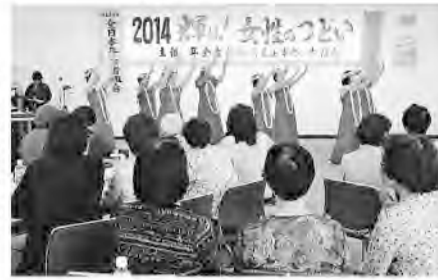
なごやかな会場風景