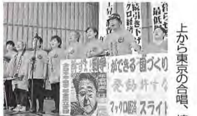
上から東京の合唱、埼玉の長生きサンバ、千葉のお手玉体操、神奈川のきよしのズンドコ節