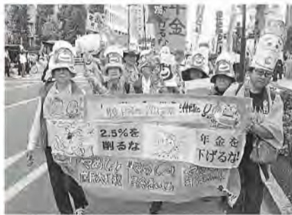
銀座をデモ行進する神奈川・麻生支部

中央集会に先立ち午前中、国会議員会館会議室に全都道府県本部と首都圏代表など約100人が厚生労働省交渉。職員に要請書を手渡し、実態を告発して年金引き下げ中止を求めました。