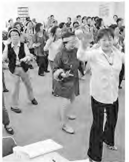
「長生きサンバ」ではじける参加者たち

「支部だけではできない楽しみ。県主催であれば参加したいわ」の声に押され「第2回・輝け!女性のつどい」を9月27日、浦和駅前パルコにて県本部と女性部で開催しました。