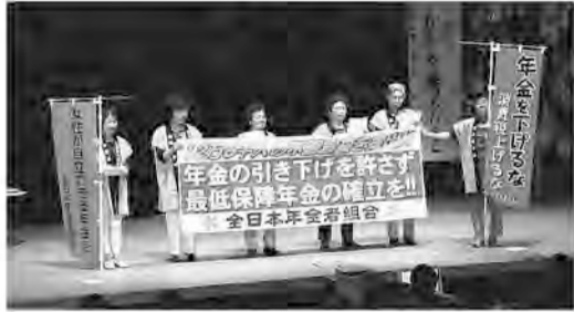
県母親大会で訴える女性支部員たち