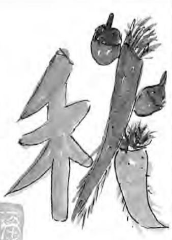
北海道・札幌市 福本 洋子