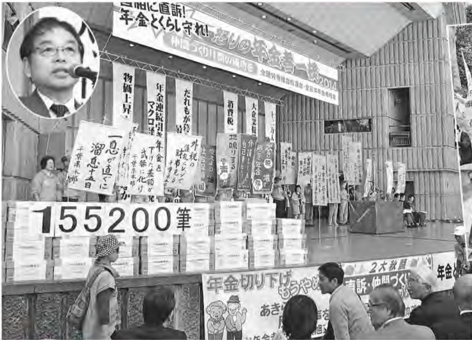
④シュプレヒコールする参加者 ⑤賑やかに始まった集会の壇上。円内はあいさつする小田川全労連議長

〒170-0005東京都豊島区南大塚1-60-20天翔大塚駅前ビル 発行人 富田 浩康 月刊1部100円(組合費に含む) 昭和57年6月30日第三種郵便物認可