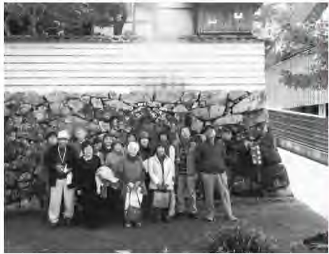
好天气に恵まれ楽しい時間。臥龍山荘の壁下で