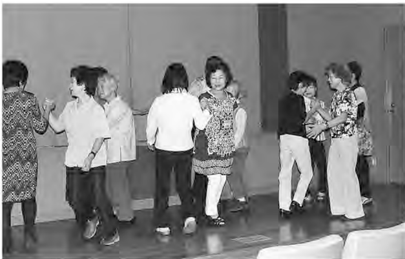
サークル活動にも一生懸命(佐倉支部)