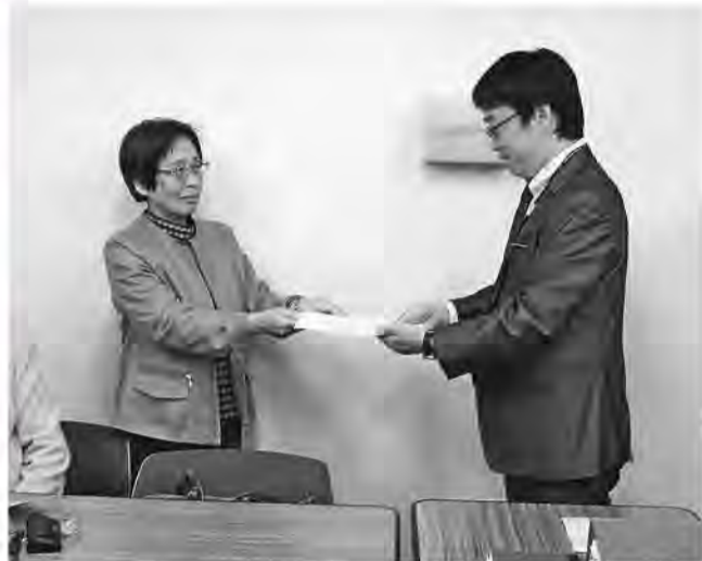
▲年金改善、先のばしせず実施をと要請