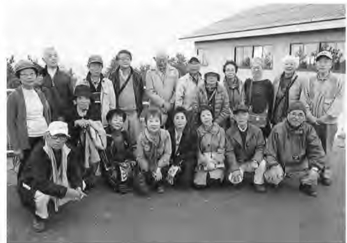
三朝温泉旅行やサークル活動で「仲間ふやし」

秋の1泊旅行は11月17、18日、塩原温泉泊で栃木路をバスの車窓から楽しみました。酒つくり工場では試飲、大谷観音の石窟には庄倒され見所いろいろ。34人が参加。2人が加入。(根本徳三)