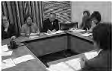
申し入れをする中央本部役員

法25条の侵害と、13条の「個人の尊重と幸福追求に対する権利」の侵害です。このことを広く国民に訴え年金裁判を社会問題にして政府を追い込み、組織の飛躍を勝ち取ろうや貧しい人ほど負担の重い消費税増税を中止すべきです。特定秘密保護法の制定、集団的自衛権閣議決定による法解釈の変更、原発再稼働、沖縄新基地建設反対、残業代ゼロの労働法制改善など激動の年ですが、戦後70年、平和憲法を守り、さらに社会保障充実を求め楽しく活動しようではありませんか。