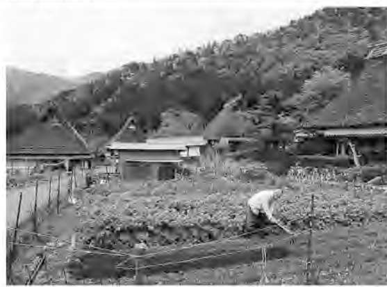
隣接する畑で畝を立てる村の農夫

山を背景にした穏やかな山里である。自然への畏敬の念を強くもって、そこに暮らす村人の温かな心も伝わってくる。人を癒す力がそこにあった。