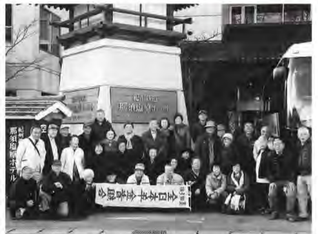
温泉宿の宴会では自己紹介。楽しみと活動と

大川沿いに建つ大洲城は、平成16年に復元した木造とはいえ威風堂々とした姿に感銘。(川口一夫)