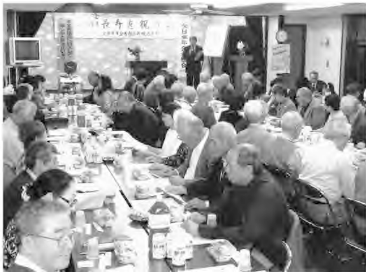
会場ビッシリと集まった「長寿を祝う会」(札幌西支部)