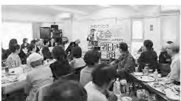
1・2・3月生まれの組合員を祝う誕生会

を出さないでいると、1回は出てみたほうがいいよ。今度はいつかなど思うようになると思うように押し、出席した誕生会。会場が少し手狭かなと思うほどの参加者、総勢47人、