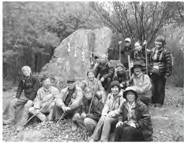
国府山城、山歩き気分で往復50分