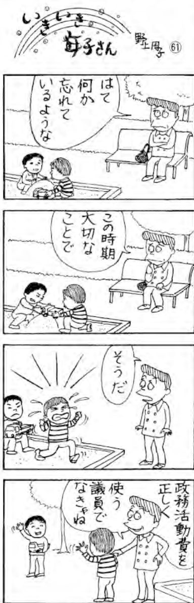
幸田露伴の句碑を拓本する男性