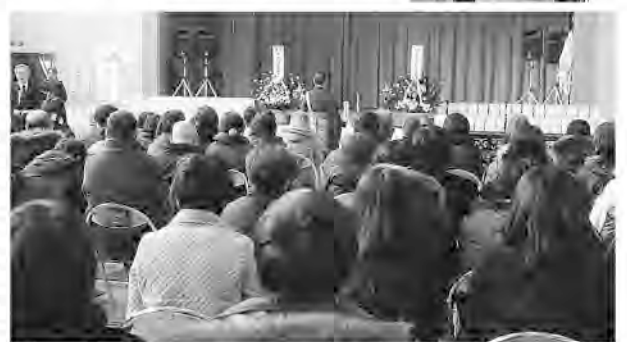
大槌町の追悼の会。旧赤浜小学校体育館で