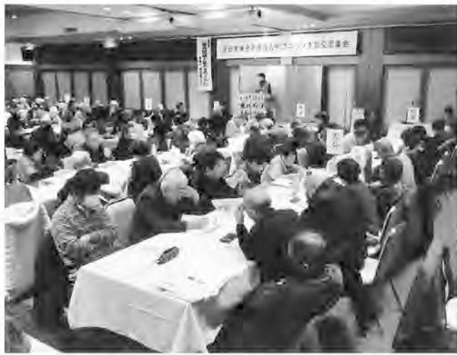
女性が活躍した九州ブロック支部交流集會