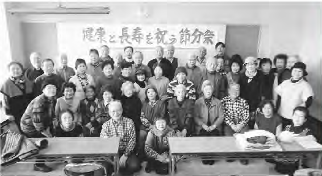
女性部主催の節分祭に50人が笑顔の参加(2月3日)

1656筆と、組合員の総力を結集して取り組んできました。一方で昨秋の仲間づくりが15人とどまったことを反省し、毎月の執行委員会「活動のてびき」を学習してきました。