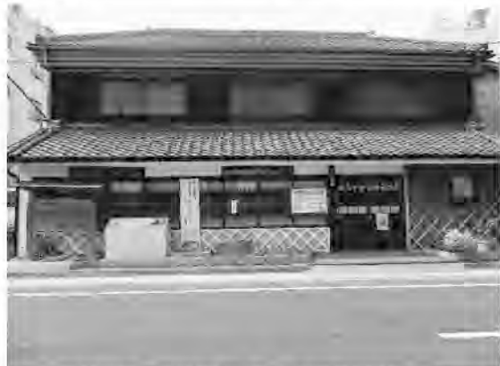
外観は土蔵作りの木下太太郎記念館

他にも尾崎史郎文学碑や高浜虚子句碑などがあるので、多くの文学碑が楽しめます。(家城経一)