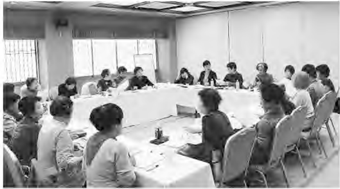
悩みなども率直に話し合った女性分科会

北関東甲(栃木・茨城・山梨・群馬)支部交流集会が3月8・9日の両日、栃木県の鬼怒川温泉で開かれ173人が参加しました。 1日目の基調報告・各 2日目は女性・共済・機関からの活動報告に続き 関紙の3つの分科会と5つの分散会に分かれての経験交流と討論が熱心に行われました。