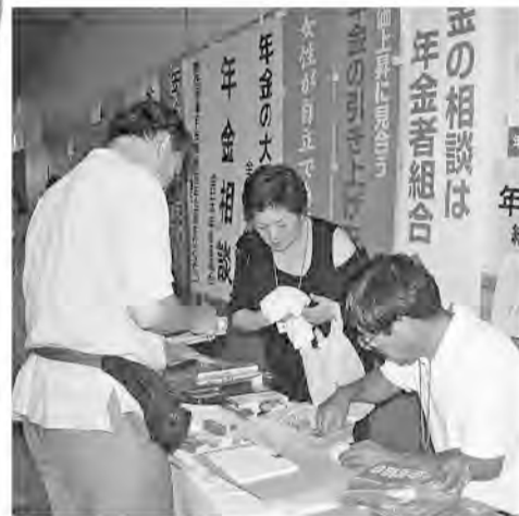
宣伝資料・物品普及も盛況