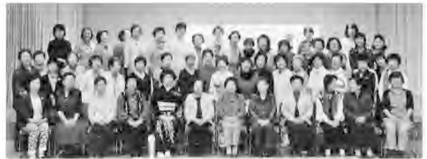
両支部合同の総会とつどいに59人