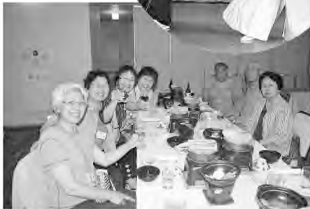
笑顔あふれる懇親会