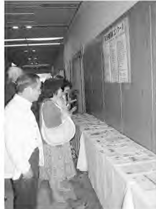
受賞紙を見る大会代議員たち

年金者組合はこの4月から①年金削減違憲裁判②最低保障年金制度実現を求める新署名活動③仲間づくりの3つの課題に取り組んでいます。いずれも年金者組合の存在意義が問われる課題です。これらの課題を日々どう融合させて運動をすすめるのか、機関紙誌で伝えるのか、役割が大きく求められています。