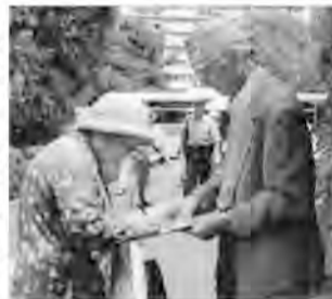
汗たぐで署名を訴える