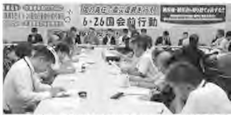
復興庁・内閣府との交渉。正面は政府関係者

体から200人が参加し衆議院議員会館前で集会を行った後、8省庁に要請行動を行いました。政府が、復興事業費の地元負担・220億円も決めた直後だけに、参加者からは、「復興の足かせになる」「被災現場の実情をみない暴挙」「被災者に失望と不安を与える」と「地元負担を撤回せよ」の怒りを込めた告発が続きました。省庁交渉でも、被災地、被災者の実情から復興に必要な、「生活支援の拡充」「生活支援金の500万円までの引き上げ」など具体的な13項目の要望が6省庁に直接行