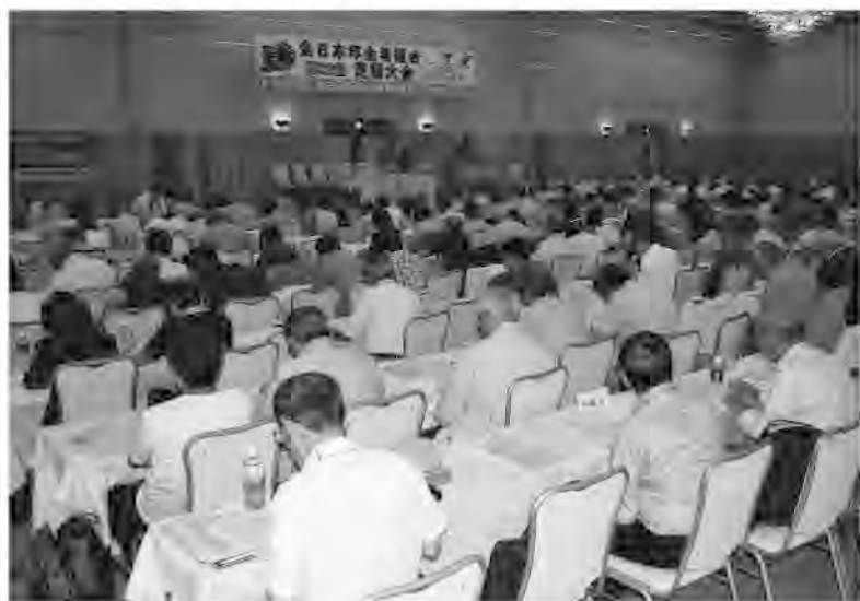
熱心に耳を傾ける代議員のみなさん