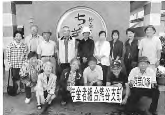
群馬県への1泊旅行を企画