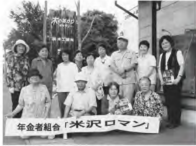
年金者組合「米沢ロマン」