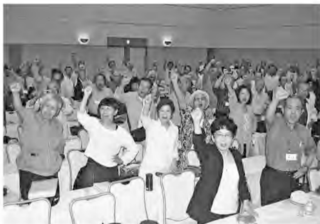
意気上がる参加者たち