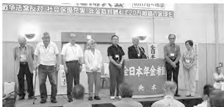
壇上に並んだ内任する中央本部役員のみなさん