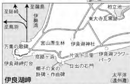
JR豊橋駅からバスで1時間30分