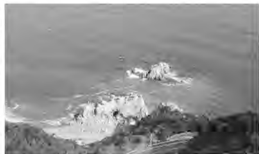
高台から見る日出の石門

柳田國男がここで拾った椰子の美の話を一緒に来られなかった藤村にしたところ、創作したのがこの叙情詩という。詩碑を右手に急な坂道を下ると波音も高らかに海が眼前に迫る。なおも進めば、視界を遮るよ