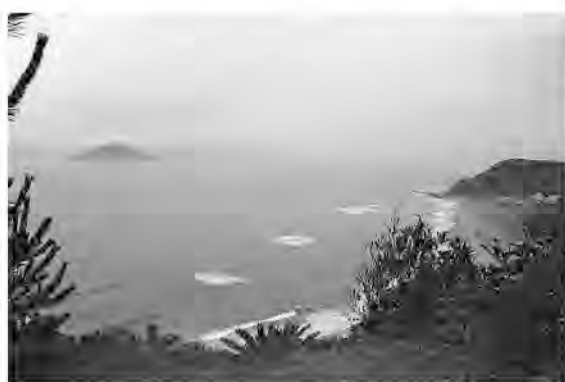
曲線が美しい恋路ヶ浜(右)と島々

は片浜十三里と呼ばれる海岸線も見渡せる。傍には島崎藤村の叙情詩「椰子の美」の詩碑も。「名も知らぬ遠き島より流れよる椰子の美一つ」。奥の石を蒼く魅せている。陽射しが傾いてきた。