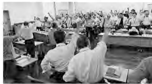
「秋の月間」成功を決意する

中でこそ前進が開かれると訴え、推進体制を確立し、「推進ニュース」を連日のように発行して支部を励ましてきた」と報告しました。