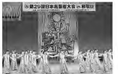
フィナーレは「アロハオエ」