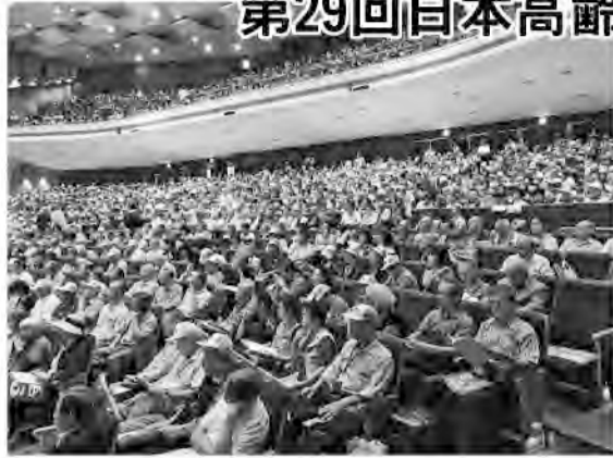
願いは同じ「戦争反対、平和を守ろう」