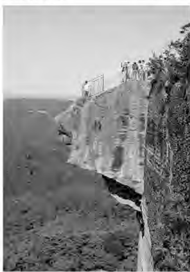
絶壁の上から下をのぞく「地獄のぞき」は若者たちに人気

日本寺は開山1300年の名刹だそう、1939年、登山者の失火で国宝大仏と堂宇をすべて消失。復興途上という。