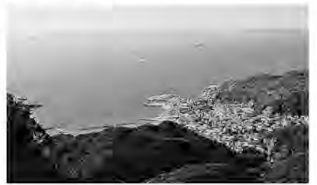
浦賀水道を久里浜港から金谷港(手前)に近くフェリー

鋸山ロープウェイの山頂駅に立つ。東京湾の入口、浦賀水道が眼下に広がり、三浦半島の先端が青く見えている。その向こうの富士は、残念ながらかすみの中。頂上展望台はもっと上だ。石段を下りて日本寺の西口管理所で拝観料を払い、境内の上り階段を辿る。