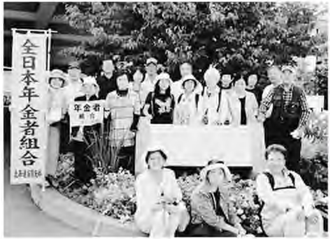
恒例の日帰りバス旅行は温泉へ