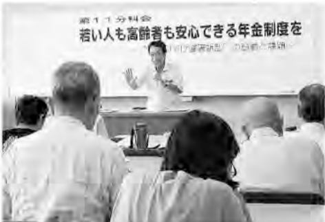
助言者は大阪府本部の加納書記長