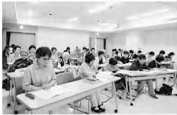
支部総会のあと女性部が結成された

支部女性部作りを目標にしてきた東広島支部に女性部が誕生しました。昨年の支部総会で提案しましたが、「あれもこれもこれ以上は」と、保留になりました。その後、話し合いを重ね