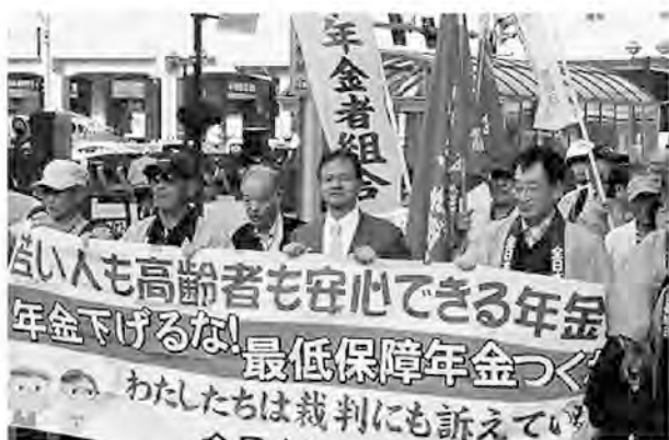
富山市街地での署名

和歌山市での県中央集会は、年金コース「ひまわり」の歌声で開会、主催者あいさつ、琴浦県地評議長あいさつ、年金学習、行動提起、決意表明、パレードと参加者に確信を与える充実した行動になりました。(深谷 登)