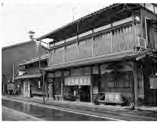
そこかしこに残る町屋は今も生活の場

イヨ捕れたかね。秋になると挨拶代わりに交わされる言葉。イヨとは鮭のこと。この村上地方の方言で、「イヨボヤ」とも呼ばれる。11月から12月は鮭魚の最盛期。今年年金をもらう高齢者たちが漁に勤しむという。その姿はもはや風物詩。そう話してくれたのは、JR村上駅から徒歩で辿り着いた城下町・町屋の一角。