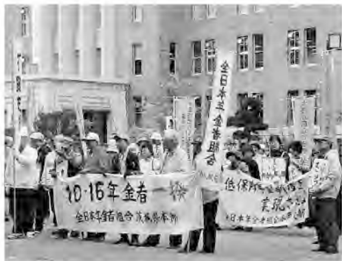
年金者一揆のパレード(茨城県本部)

茨城県本部は、6カ年計画を基本に据えた活動を展開して2013年から2年連続して約100人(純増)の仲間を増やしてきました。秋の大運動について、10月2日に支部代表者会議を開催して月間の県本部目標を提案するとともに、各支部から自主目標を申告してもらって討議を深め全支部の意志統一を行うことが出来ました。支部代表者会議での討論は、なんと「原則的活動」をすすめることに尽きるということでした。その最大の保障は、定期支部総会にあります。県本部の大会で決まったこと