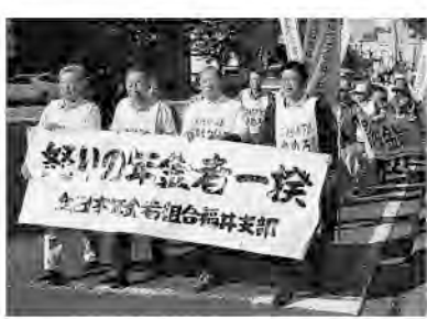
福岡市街地での署名

10月16日、全国一斉に10回目を迎える「年金者一揆」が行われました。福井でも福井市中央公園