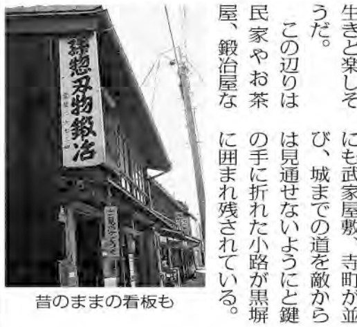
昔のままの看板も

上城は、江戸時代の歴代藩主により整備されたが現在は石垣が残るのみ。町に視線を戻せば町歩きする人々が鮭加工販売店の暖簾をくぐる。鮭漁が秋の風物詩なら、天井から逆さまにつるされた鮭の姿は冬の風物詩。これからさらに季節ごとの風に吹かれて、鮭も、村上の町もまた熟成していく。(井上ますみ)