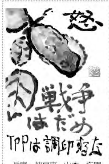
兵庫・神戸市 山本 浩明