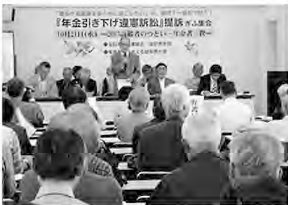
提訴のあと報告集会(10月21日)