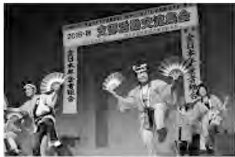
都本部女性の会舞踊団「それいゆ」の「すずめ踊り」

を凝らした出し物で交流。「楽しい一日が過ぎたわ」「着物の着付け、簡単な着付け、私も着てみたい」「来年は私たちの作品も出店したい」宣言や、違