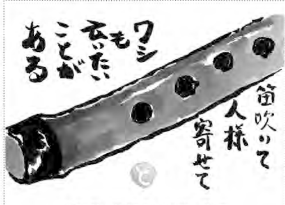
北海道・札幌市 岩淵 敏江