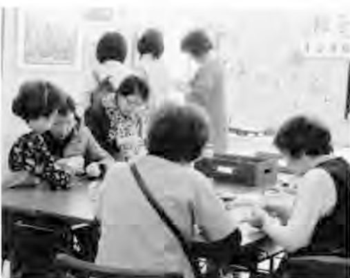
「手づくり体験」コーナーも

今年で12回目となった年金者組合札幌西支部の「手作り作品展」。川柳・夢絵、絵画、絵手紙など、組合員70人が百十点の力作が展示されました。