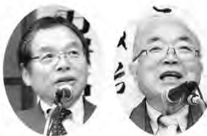
田村智子参議院議

秋の仲間づくり月間では12万人を突破して12月の中央委員会を迎えようと呼びかけました。共催する全労連の小田川義和議長は「戦争法を廃止するために総がかり行動実行委員会では2000万統一署名に取り組み。この署名運動と年金裁判を共にたたかていきたい」とあいさつ。