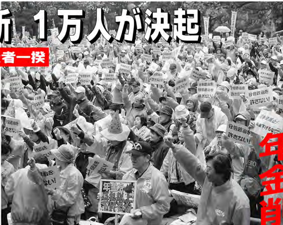
▲安倍政権いっせいに怒りの声をあげる組合員ら(10月16日、中央集会)