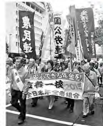
◀賛同団体を先頭にデモをする中央集会参加者

大阪府本部の「年金者一揆inおおさか」は10月16日、なんば高島屋前に組合員ら650人が結集し、周辺はオレンジカラーで埋めつくされました。太鼓の音も勇壮に大宣伝行動となり、写真、大阪府知事・市長のダブル選挙で維新政治の1掃を、年金下げるな、戦争法廃止などを呼びかけました。(詳報6面)