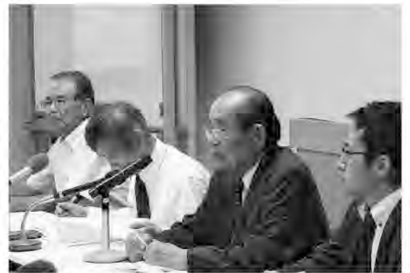
記者会見を行う原告団(10月23日)