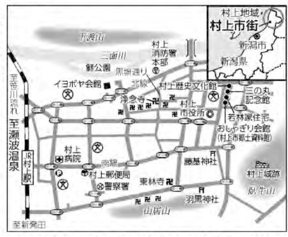
村上駅の日本海側は瀬波温泉(9月号掲載)

女性か、逆さにつるされた鮭の姿を布で手作りしたお土産品を持参。生き生きと楽しそうだ。この辺りは民家やお茶屋、鍛冶屋など、城までの道を敵からは見通せないようにと鍵の手に折れた小路が黒塀に囲まれ残されている。