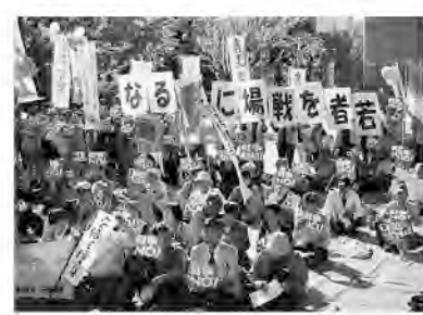
山形市街地での署名

争法案への反対運動が六〇年安保闘争と違い自発的な運動だったと述べ、日本共産党が呼びかけた「戦争法廃止の国民連合政府の実現」への期待と注目を表明しました。そ