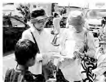
深川市街地での署名

10・15年金者一揆に向け、10月4日の深川支部定期大会で「チラシ一枚、署名1筆でもいい。全員参加の行動を実現しよう」と訴えました。 15日から17日にかけて、次々と寄せられる各班長からの報告に胸が躍りました。これまでは、