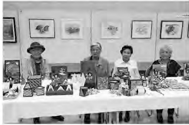
きれいに展示された作品群

第18回文化祭が10月3、4日の2日間、館林市文化会館の小ホールで盛大に行われました。1市5町の教育委員会と上毛新聞社・館林ケーブルテレビも後援。公民館等の公共施設に40枚の