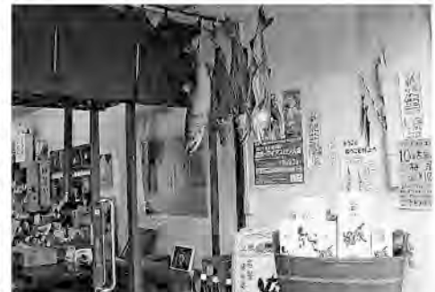
小さな店にも逆さの鮭が。町屋の公開と見学は村上町屋商人会が奨励している。

がらりと格子戸を開ければ店の主人が気さくに迎え入れてくれる。黒光りする梁や柱、仏壇が、囲炉裏が、2階に続く低い階段が、迎え入れてくれる。別の次元に踏み入れた感覚に包まれていると、「昔のままなのはこの茶の間だけで、奥の部屋は内装も変えて床暖房です」と笑って教えてくれた。話し込んでいくと、近くに住む80代の角だろと探してみれば