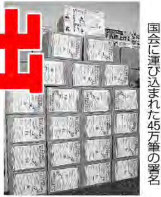
国会に運び込まれた45万筆の署名