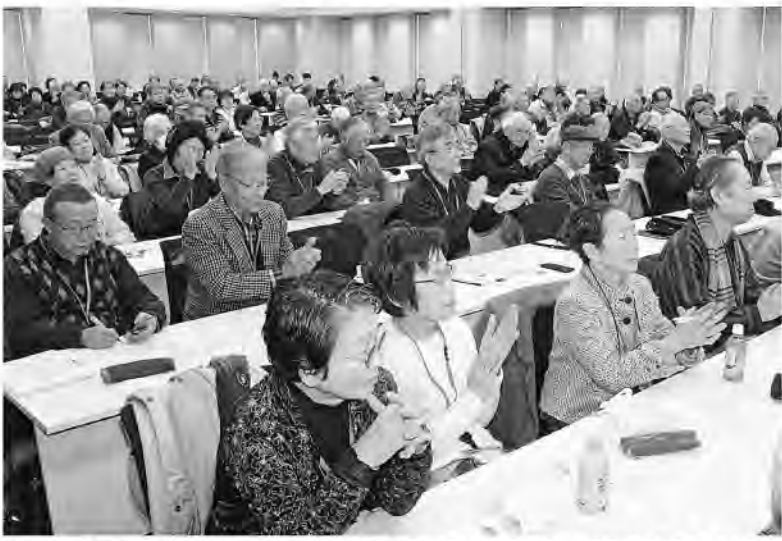
壇上の報告に真剣に耳を傾ける参加者(1月20日、衆院議員会館で)

「安心できる年金制度の実現を」「戦争法廃止へ野党は共闘を」と全日本年金者組合は1月20日午後、衆院第1議員会館で集会を開き、全国から結集された44万9914筆の年金署名と1880筆の戦争法廃止署名を国会に提出しました。年金署名は6月の第34回中央委員会までに100万筆達成をめざしており、全国の組合員が取り組みを強めています。