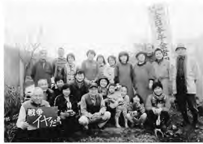
雨間の霧の中、参加者の笑顔

雪がしんと降りしきる1月19日。新見支部(岡山)と庄原支部(広島)合同の新春のつどいが開かれ、広島県庄原市の国民休暇村帝釈峡に37人が集いました。新見支部長と庄原支部長それぞれが開会挨拶。乾杯の首頭で宴会が始まりました。その後、参加者の自己紹介と今年の抱負を述べる1分間スピーチ、コーラス、カラオケ等、食べて飲んで唄い語り、楽しいつどいとなりました。国民休暇村帝釈峡のロビーにて記念撮影。写真。 (毛利光彦)