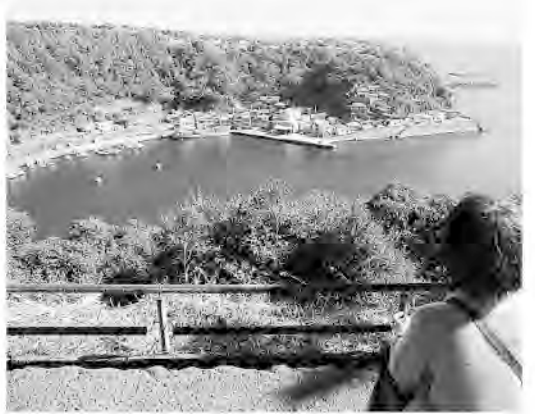
見晴台から波浮港

油所に持ち込みます。椿の実10キロで油1・8リットルと交換されます。実を砕いて、蒸して、搾って