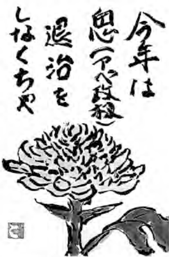
北海道・札幌市 岩淵 敏江