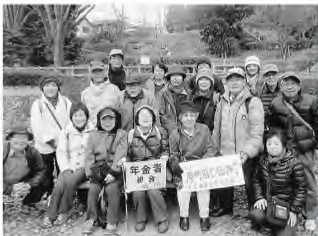
5kmのコースを歩き通して

原町田七福神へ 新春恒例の歩き初めとして1月6日、町田市の原町田七福神めぐりを行い18人が参加。5km弱のコースを元気に歩き通しました。昼食場所の公園で乾杯、正月のおせち料理などをいただきながら歓談しました。参加者の中には、戦争法廃止の署名への協力を訴えながら歩く人もいました。(唐澤公平)