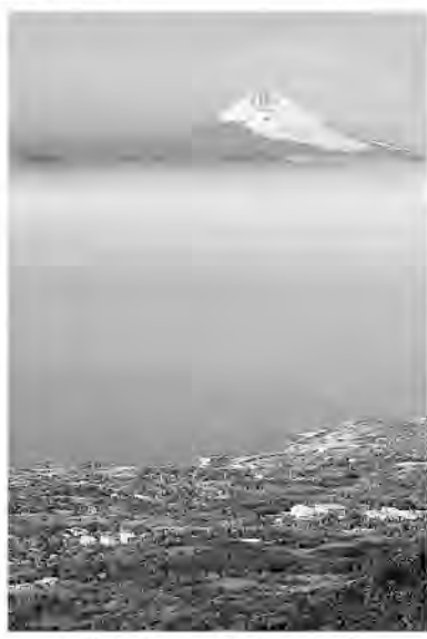
大島から伊豆の山々と富士

東京湾の入り口に浮かび、黒潮が流れ、温暖な火山の島、伊豆大島(東京都大島町)。東京、神奈川、静岡、千葉からのアクセスも良く、「ちょっと行くか」の距離です。訪ねた日、朝、熱海からジェット船(50分)で来て、大島公園、三原山、椿ガーデン、椿トンネルなど島北側の観光地をバスで回り、午後便で熱海に帰った高齢者の一行がいました。