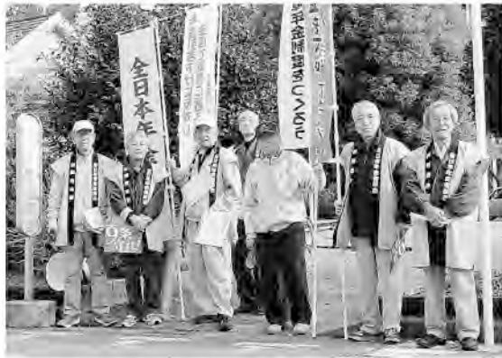
支部長をはじめ支部・分会役員が揃って宣伝活動

前橋支部では、マクロ経済スライドの発動により今後30年間も続く年金引き下げを、多くの年金受給者に知らせようと執行委員会で話し合いました。まずは年金支給日に郵便局に引き出しに来る年金者に訴えようと、12月15日に前橋中央郵便局