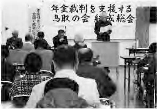
年金裁判を支援する会 鳥取の会結成総会

昨年12月12日、年金裁判を支援する鳥取の会が結成総会が鳥取市県民ふれあい会館で開かれ、36人が参加しました。写真