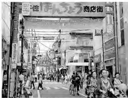
賑わう本町商店街から宿場町通り商店街

是を矢立の初として、行道なをすゝまず。人々は途中に立ならびて、後かげのみゆる迄ほと、見