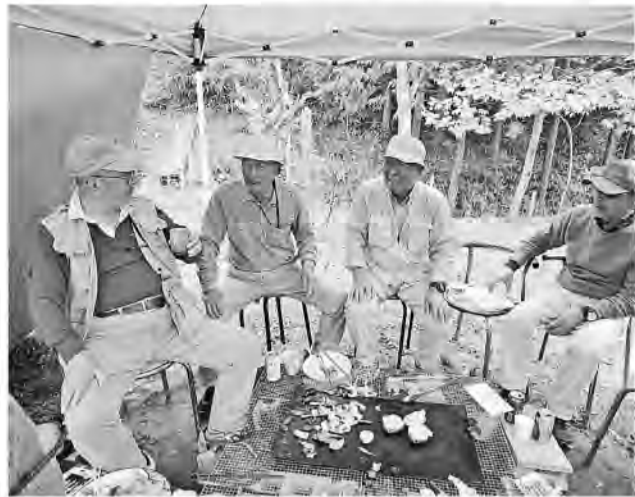
散策と焼き肉で歓迎会