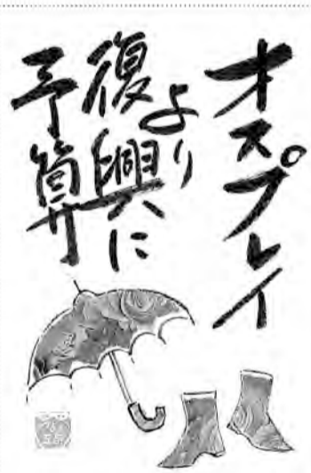
兵庫・明石市 三宅 弥生