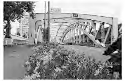
日光街道に架かる千住大橋

松尾芭蕉が「奥の細道」の旅に出たのは元禄2(1689)年3月27日(新暦5月16日)、芭蕉46歳。浅草から船で隅田川をさかのぼり、「千じゆと云所にて船をあがれば、前途三千里のおもひ胸にふさがりて、幻のちまたに離別の泪をそぐ。」