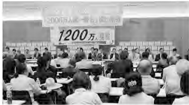
全野党から議員が激励にかけつけた戦争法反対2000万人統一署名提出集会

5月19日、戦争法(安保法制)廃止を求める「2000万人統一署名」を共同で呼びかけた29団体が、衆院第一議員会館で署名提出集会を開催、集まった1200万人の署名を提出しました。署名提出では、29団体