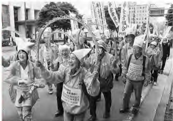
威勢のいい神奈川県年金者一揆(4月1日)

49の全支部が自主目標を 持つ「春の仲間づくり月 いた状況を直視し、3月中旬」をスタートした神奈川 県本部は5月31日 現在、横浜青葉、大和・綾瀬、愛川、横浜中、川崎高津の5支部が目標を達成、33支部が実増となり、県本部として実増97人で1万752人となりました。目標の1万1000人まで248人です。 同県本部は昨秋