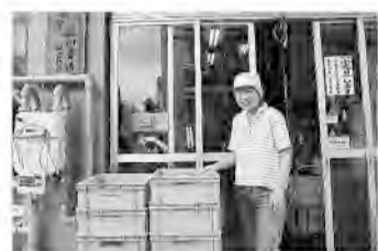
やっちゃん場でこんにやく屋5代目の奥さん

ここは「やっちゃん場」と呼んだ幕府の御用市場で、周辺の湿地帯から運び込まれる野菜と川魚を商って賑わったという。昭和20年の空襲で、千住地域一帯はほぼ消失し、「やっちゃん場」は東京足立市場となった。