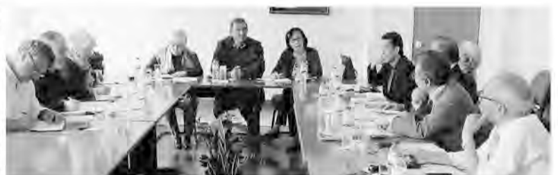
リスボンでCGTP退職者組合と懇談

た。緊縮策を含む予算案に対し、憲法裁判所は8回にわたって違憲判断を下したことも運動の大きな支えとなった」と言い、年金2カ月分のボーナス分は復活しました。 こうした中、昨年10月の総選挙では、緊縮政策を進める民主社会党(保守)は過半数議席を割り込み、他方、第2党の社会党は「反緊縮」の民意を受けて、ポルトガル共産党など左派3党の協力を得て、昨年12月に新政府をスタートさせ、緊縮権をスタートさせ、緊縮見直しに踏み出しています。 緊縮政策による社会保障の削減という野党共同